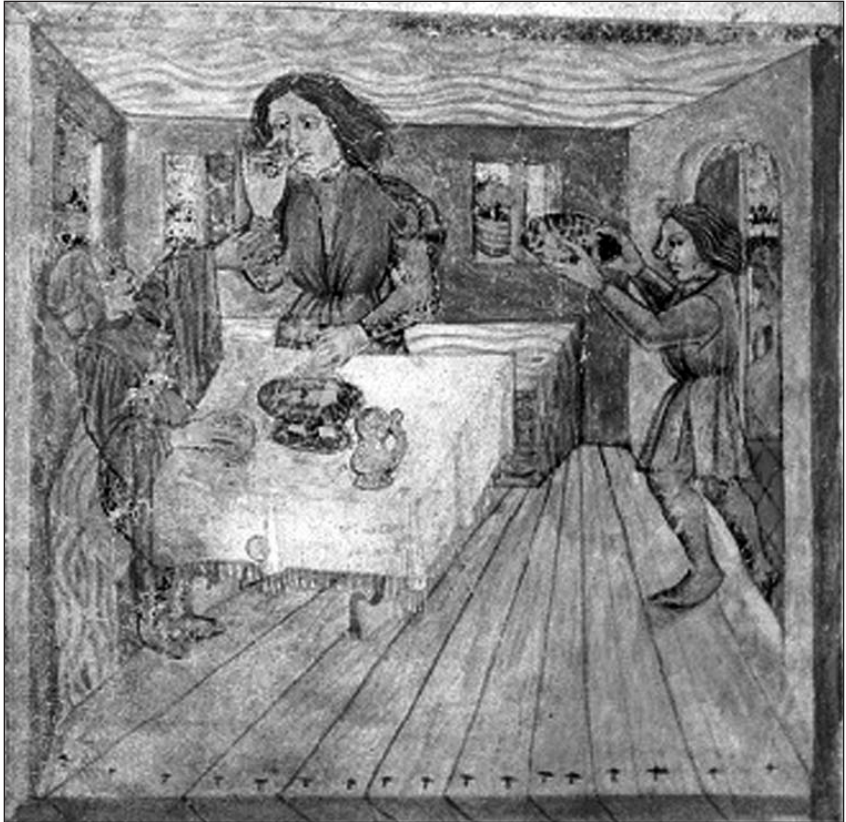
Abb.1: Illustration zum Januar: Hs. 1e 7, Bl. 2v