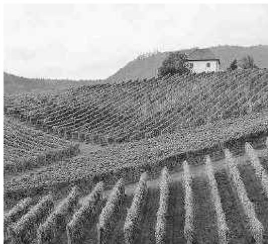
Slovinské vinice