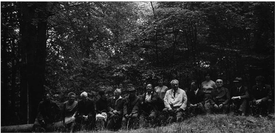
Obr. 8. Komise (aktiv) státní památkové péče Okresního národního výboru Plzeň-jih na Chýlavě u Blovic v roce 1976.

uměleckoprůmyslové, historické a literárněhistorické. Základem tehdejší archeologické sbírky byly soubory z eneolitických výšinných sídlišť jižního Plzeňska, významnou součástí se však staly nálezy z období středověku a raného novověku, namátkou nálezy z cisterciáckého kláštera v Pomuku, z Obrova hradiště u Žinkov nebo ze slovanského hradiště Hůrka ve Starém Plzenci.