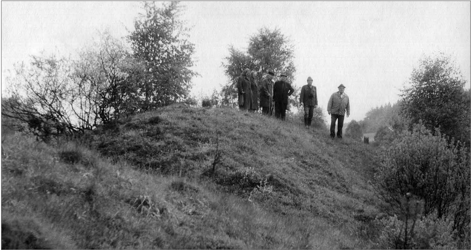
Obr. 7. Karel Škrábek při práci komise státní památkové péče na lokalitě Čmelíny-Sejpy (okr. Plzeň-jih).