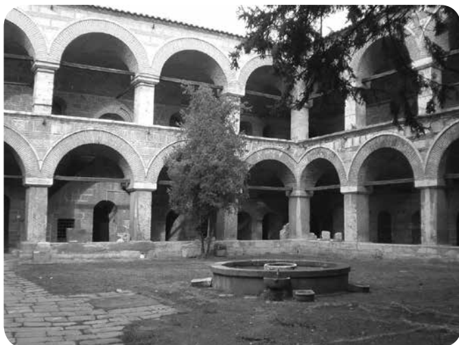
5. Karavansaraj Kuršumli han, vnitřní dvůr s kašnou a arkádovým ochozem v přízemí a patře, Skopje [cit. 3. 6. 2022]. Dostupné z: https://commons.wikimedia.org/wiki/File:Kurshumli-An-Skopje-MK.JPG