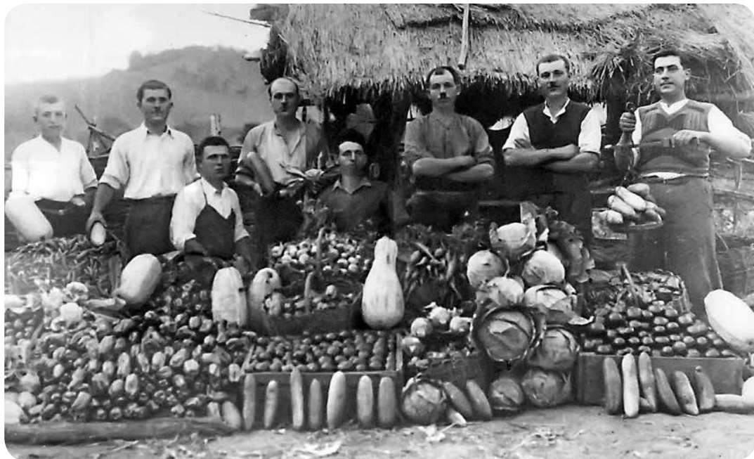
3. Bulharští zahradníci v Maďarsku, 30. léta 20. století [cit. 3. 6. 2022]. Dostupné z: https://bnr.bg/hristobotev/post/101130685Oves?Haberiorur quonsidem et verebenes

V rámci své vědecké činnosti se zabývala etnokulturní problematikou Balkánu ve (středoevropské a mediteránní komparaci. Jejím dalším zájmem byla česká tradiční kultura, urbánní etnologie a dějiny etnologie. Vystudovala etnologii a historii v Brně, specializovala se na ročním studijním pobytu v Bulharsku v 70. letech. Pracovala v brněnské pobožce Etnologického ústavu AV ČR a později na slavistice Filozofické fakulty MU.