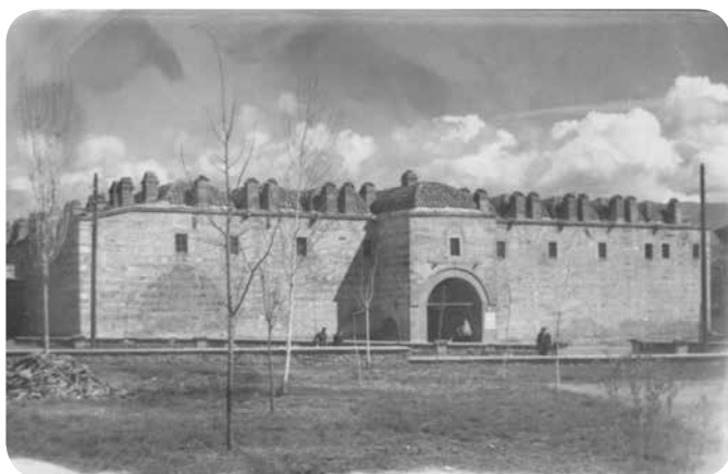
4. Karavansaraj Kuršumli han, průčelí se vstupem, Skopje, 30. léta 20. století [cit. 3. 6. 2022].