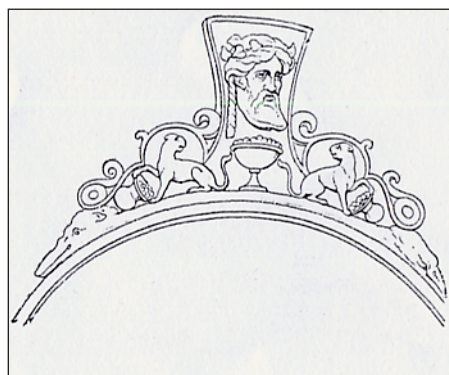
Obr. 2:3. Ostrovany I, skyfos typu Meroe, výzdoba držadla (PULSZKY 1897).

oblíbená božstva v 2. a 3. stol., což lze spojit s jeho „kompetencemi“, které byly orientovány především na venkov a soukromou sféru, otium . Zvláštní oblibě se těšil v období vlády císařů Traiana 40 až Antonina Pia, s možným pokračováním