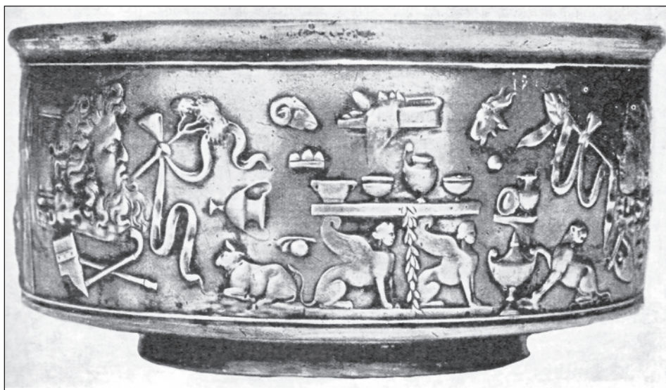
Obr. 1:1. Stráže II, skyfos typu Meroe, výzdobné pole A (SVOBODA 1972).