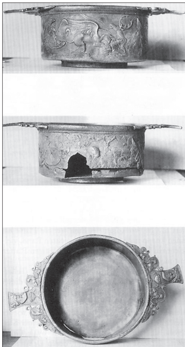
Obr. 3. Skyfos typu Meroe z Ostrovan (KÜNZL 1997).

orientálce je však udivující přítomnost plnovousu. Z římského výtvarného projevu sice známe zobrazení vousatých orientálců, 46 ti jsou ale takto vyobrazováni ve zcela jiném kontextu. Je nutno poznamenat, že při procházení studovaného materiálu jsme nenarazili na obdobný typ masky, proto prozatím necháme otázku určení otevřenou.