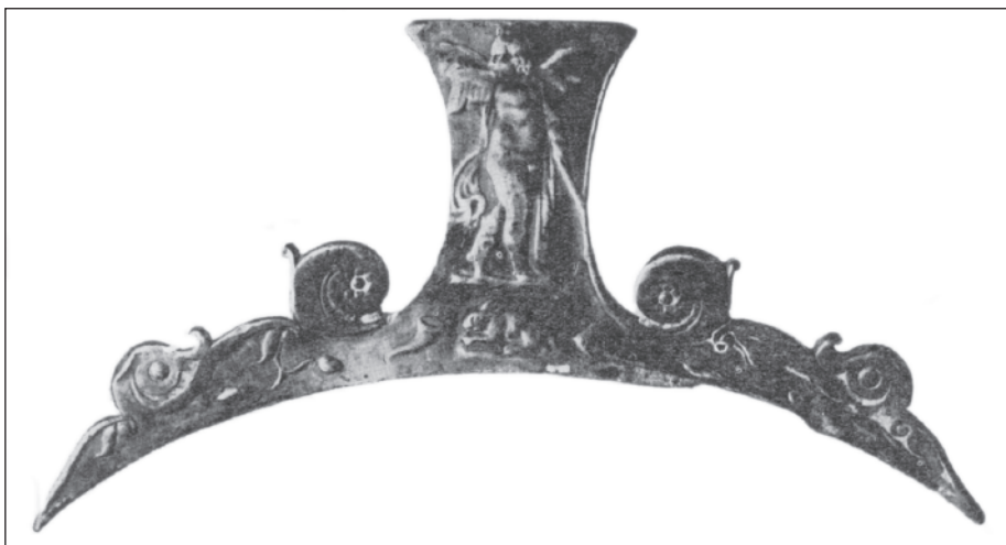
Obr. 1:3. Stráže II, skyfos typu Meroe, držadlo (SVOBODA 1972).

Každé rameno držadla je na vnější straně členěno jednou volutou úponku končící rozetou a jednou úponkovou volutou bez rozety. Ramena jsou pak zdobena každé jednou větvičkou s několika vavřínovými lístky. Svou formou navazují úponky na ztvárnění z 1. stol. n. l. Jistým vzorem mohly být úponky podobné těm, které zdobí držadla nádob z Casa di Menandro v Pompejích nebo větší držadlo (F 11) z mušovského hrobu (KÜNZL 2002). Úponky z držadla ze Stráží jsou však již hrubší, k nim příslušné analogie nacházíme mezi materiálem z 2. stol. 30