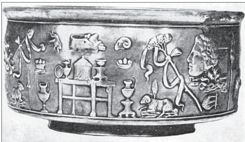
Obr. 1:2. Stráže II, skyfos typu Meroe, výzdobné pole B (SVOBODA 1972).

Jako první popíšeme ve směru zleva doprava výzdobné pole A (obr. 1:1). Výzdobné pole A je na levé straně rámováno maskou vousatého satyra. 6 Vousy