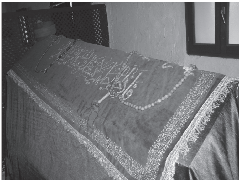
Obr. 1. Kenotaf šajcha Abdulláha ad-Daghestáního, devětatřicátého velmistra tariqy. Jeho skutečná hrobka se nachází v Damašku.

jako Mudžaddidíja. Na základě podobné proslulosti jednatřicátého světce tariqy Chálida al-Baghdádího (z. 1827) se ustavila větev jménem Naqšbandíja Chálidíja. A přes další odnož Daghestáníji se již dostáváme k osobitému řádu vzniknuvšímu díky aktivitám a charismatu šejcha Muhammada Názima ʿÁdila al-Haqqáního.