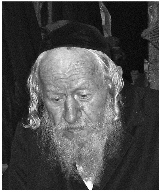
Obr. 5: Chasid, Izrael, dnes.

Kult vrcholil v roce 1759, kdy se slavilo padesáté výročí přenesení kříže do Vídně. 14 Zmíněné historické události upozorňují na dobu, kdy zašovská multiplikace trinitářské-