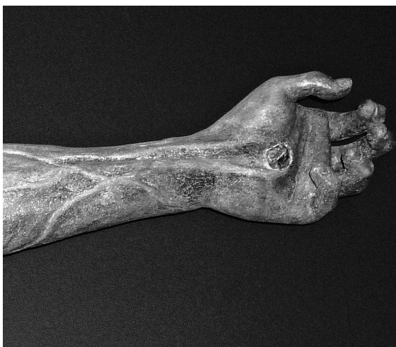
Obr. 8: Krucifix, nejdříve kolem 1708, detail, Zašová, bývalý kostel trinitářů.