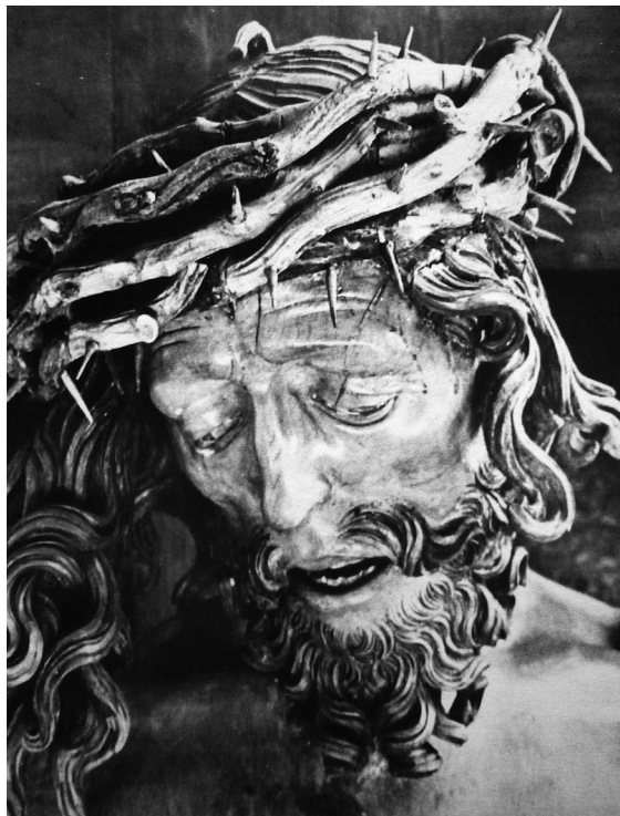
Obr. 7: Veit Stoss, Krucifix, kolem 1520, detail, Norimberk, St. Sebalduskirche.