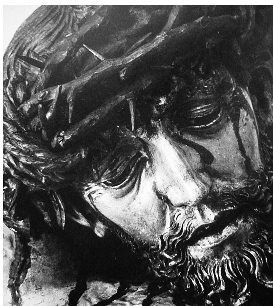
Obr. 4: Krucifix, kolem 1520–1530, Vídeň, bývalý kostel trinitářů.