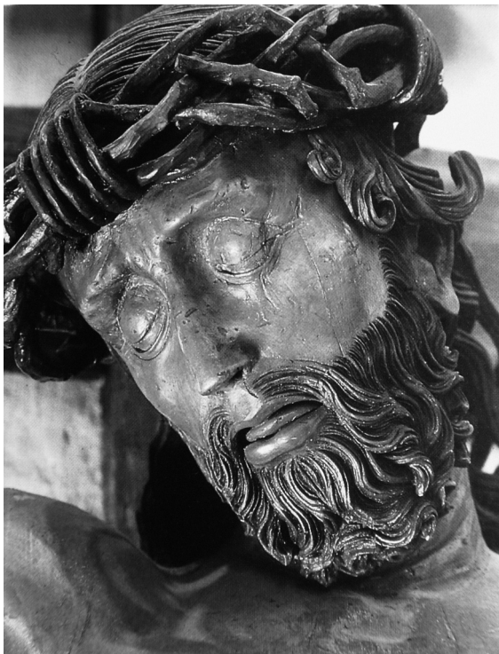
Obr. 6: Krucifix, detail, krátce po 1490, Kefermarkt, farní kostel.