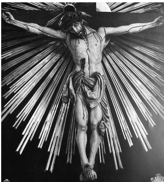
Obr. 3: Krucifix, detail, kolem 1520–1530, Vídeň, bývalý kostel trinitářů.