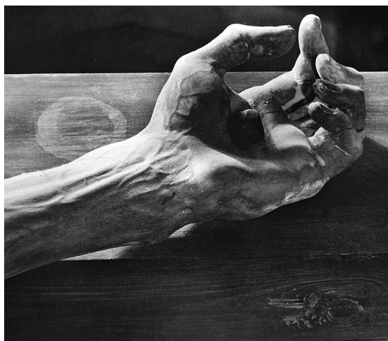
Obr. 9: Veit Stoss, Krucifix, kolem 1520, detail, Norimberk, St. Sebalduskirche.