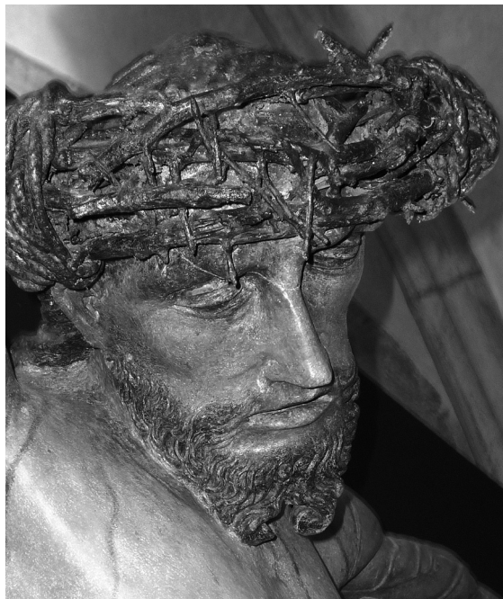
Obr. 2: Krucifix, detail, nejdříve kolem 1708, Zašová, bývalý kostel trinitářů.