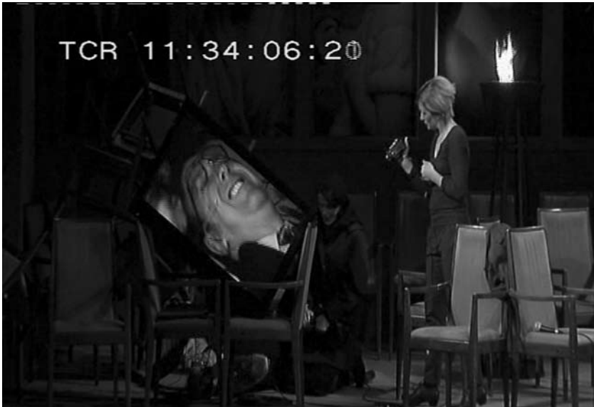
Obr. 3. Jevištní akce je přerámována zmožením obrazu. Dochází k její multiplikaci a simultaneitě. Pro diváky tak nastává otázka, zda sledovat herce, či jejich obraz, nebo střídavě věnovat pozornost obojímu.

živé herce, či jejich obraz, nebo střídavě věnovat pozornost obojímu (Obr. 3). Lze říci, že díky tomuto faktu a současně díky vědomí „přiznanosti“ technických prostředků pak diváci zakoušejí určité estetické potěšení. To je charakteristický intermediální rys.