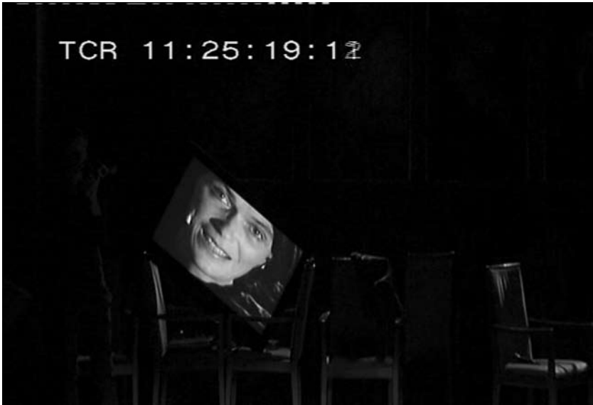
Obr. 2. Obrazovka je jediným zdrojem, z něhož je možné vidět mimiku herců. Záběr kamery umožňuje mnohem detailnější pohled, než jaký může divák běžně vidět pouhým okem.

kamery je v reálném čase přenášena na LCD televizi o úhlopříčce zhruba jeden metr, umístěnou na jevišti „našikmo“ na křesle (Obr. 1). Tento úhel je záměrně netradiční a naznačuje i určitou deformaci, respektive subjektivitu pohledu Jess na své rodiče. Obraz z kamery představuje její hlediskový pohled (záběr). Na začátku scény se jeviště stmívá. Práce s intenzitou světla podporuje viditelnost snímaného obrazu, neupozorňuje tolik na herečku na jevišti a naopak vede záměrně divákovu pozornost k oběma hercům na obrazovce. Současně se významově váže k momentu vyprávění rodičů o Jessině hrobu ve stínu sousední hrobky.