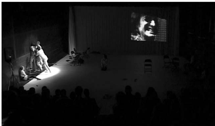
Obr. 7. Začlenění práce s kamerou umocňuje skrze detailní záběry fyzičnost jednání spojeného s násilím.

intermediálních prací na současných českých jevištích a v tomto smyslu může kvalitativně konkurovat divadlům v evropském kontextu.