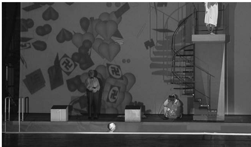
Obr. 5. Výklad postav staví Learovy dcery do analogie s fašismem a komunismem, které jsou zastoupeny obecně známými symboly.

Goneril po zpívaném výstupu na skokánku skáče v pomyslném závodě o otcovu přízeň do prostoru bazénu. Společně se zvukovým efektem rozstříknuté vody obsahuje promítaný záběr vlny kterou skokem vystříkla. Namísto vody jí však tvoří červená srdce, mezi nimiž se nacházejí hákové kříže. Z významového hlediska tento postup odhaluje pokrytectví Goneril, u níž se za slovy lásky skrývá její pravá povaha. U postavy Regan se postup v jednotlivých fázích zrcadlově opakuje. Rozstříknutá voda se na plátně skládá z červených srdcí společně se srpy, kladivý a rudými hvězdami. Výklad postav staví obě dcery do analogie s fašismem a komunismem, které zastupují obecně známé symboly 18 (Obr. 5).