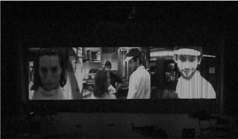
Obr. 8. Závěrečná scéna se odehrává bez fyzické přítomnosti herců na jevišti. Sekvence se skládá z děleného obrazu jejich tří kamer. Vzbuzuje iluzi, že se děje v reálném čase, přestože je předtočena.

iluzi. Sekvence tímto způsobem iluzi popírá, ale současně je jejím záměrem vzbudit iluzi jinou. Promítaná scéna působí dojmem, že je na plátno přenášena v reálném čase, přestože je předtočena. Závěrečná scéna se odehrává bez fyzické přítomnosti herců na jevišti. Vytváří pocit, že se divák může společně s nimi vydat za stěnu, jež mu přehrazuje východ. Kamery, respektive projekce ze záznamu, jsou pak těmi prostředky, jež to alespoň zdánlivě umožňují (Obr. 8).