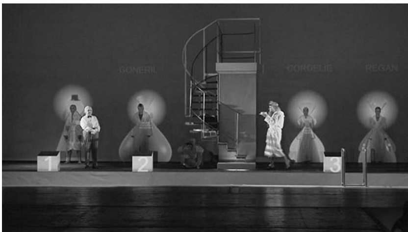
Obr. 4. Projekce zastává funkci expozice postav. Současně vytváří jejich kostýmy v přímé interakci obraza s herci, kteří slouží jako živoucí projekční plocha.

Na herce stojící před plátnem v bílých županech jsou promítány animované barevné kostýmy, které tak projekce kompletně vytváří. Vzbuzuje iluzi, že ženy mají na sobě róby s dlouhými sukněmi, mužští představitelé vysoké boty, pláště, paruky a nad svými hlavami cylindry. Herci slouží jako živoucí projekční plocha v přímé fyzické interakci s projekcí (Obr. 4). Promítaný obraz, ve vztahu k mizanscéně přesně vypočítaný, odpovídá zcela konkrétním místům jeviště. Jedná se v jednodušší variantě o postup videomappingu, směru vizuálního umění, jenž používá projekci na objekty, zejména budovy, v přesných liniích architektonického řešení, aby došlo ke změně perspektivy jejich běžného vnímání.