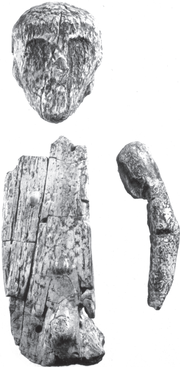
Obr. 61 Hrob Brno II, mužský idol z mamutoviny. Statuette masculine en ivoire.

o průměru 22 mm, z téhož materiálu se ztratilo již ze sbírek Technische Hochschule.