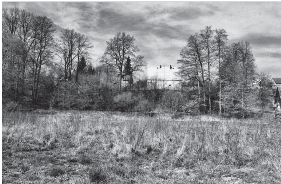
Obr. 1. Hradec, areál č. p. 7 – poloha údajného drobného středověkého opevnění, pohled od jihovýchodu. V popředí plocha zaniklého rybníka, nad ním terénní hrana s domem č. p. 7, vlevo terénní deprese s drobnou vodotečí, vpravo terénní zářez s pěšinou.

Abb. 1. Hradec, Areal Konskriptionsnr. 7 – Lage der angeblichen kleinen mittelalterlichen Befestigung, Blick von Südosten; in der Mitte ein verschwundener Teich, oberhalb davon die Geländekante mit Haus Konskriptionsnr. 7, links eine Geländedepression mit kleinem Wasserlauf, rechts Geländeeinschnitt mit Fußweg.