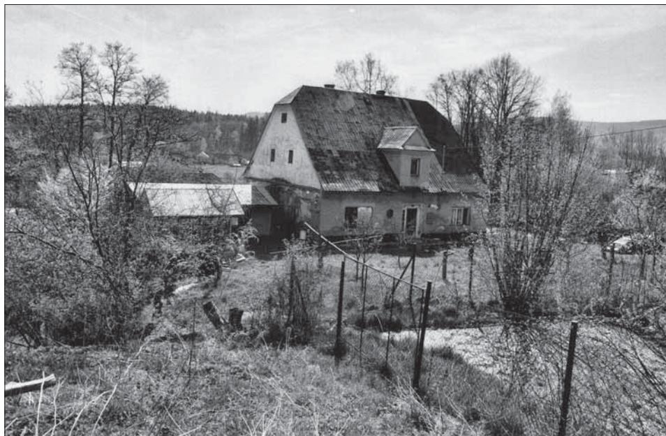
Obr. 3. Hradec, areál č. p. 7 – poloha údajného drobného středověkého opevnění, pohled od severu. V popředí betonová nádrž pod pramenem.