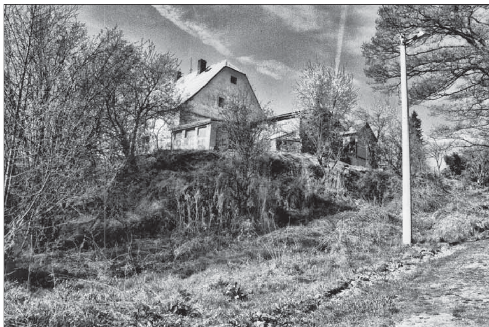
Obr. 4. Hradec, areál č. p. 7 – poloha údajného drobného středověkého opevnění, pohled od východu na hranu terénní terasy a vyústění severovýchodní terénní deprese v drobnou vodoteč a pěšinou. 17. 4. 2009.