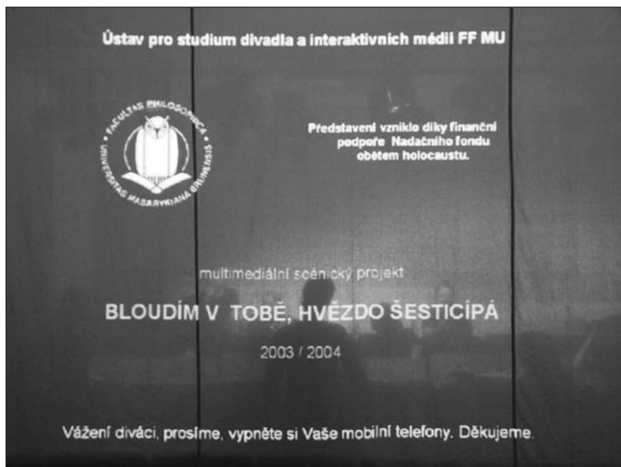
Obr. 1. Fotografie z představení Bloudím v tobě, hvězdo šesticipá