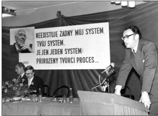
Obr. 5. Blíže neurčená konference, nedat.