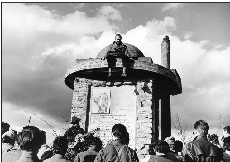
Obr. 2. Akce Hugo, 1962, davová recitace Máje u Máchova pomníku.