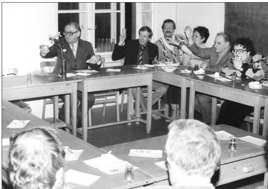
Obr. 9. Setkání absolventů, 1989.