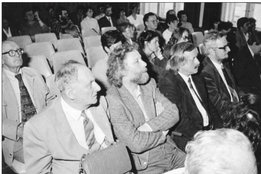
Obr. 7. Sekání absolventů, FF MU, 1989.