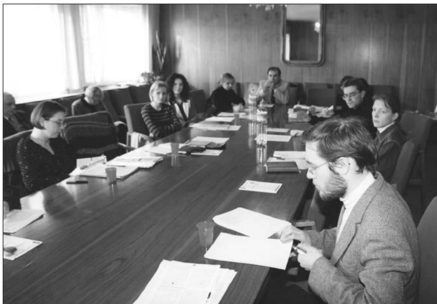
Obr. 17. III. symposium mladých teatrologů, 1999.