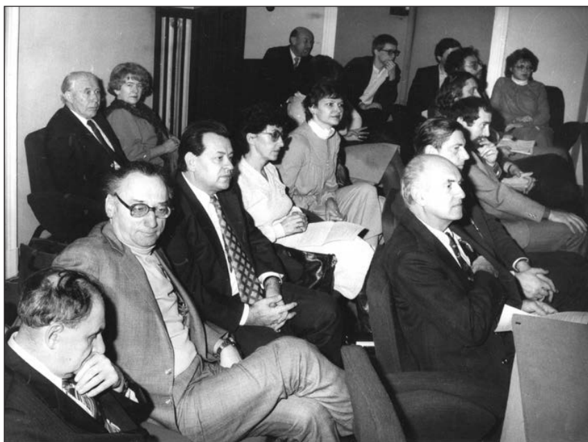
Obr. 8. Setkání absolventů, FF MU, 1989.