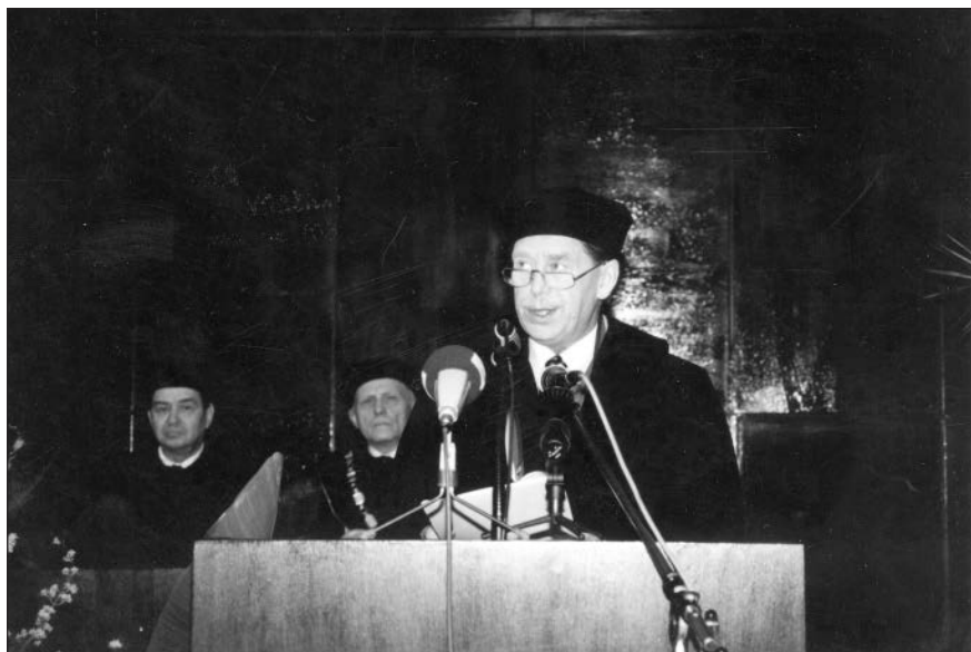
Obr. 10. Čestný doktorát pro Václava Havla, 1993.