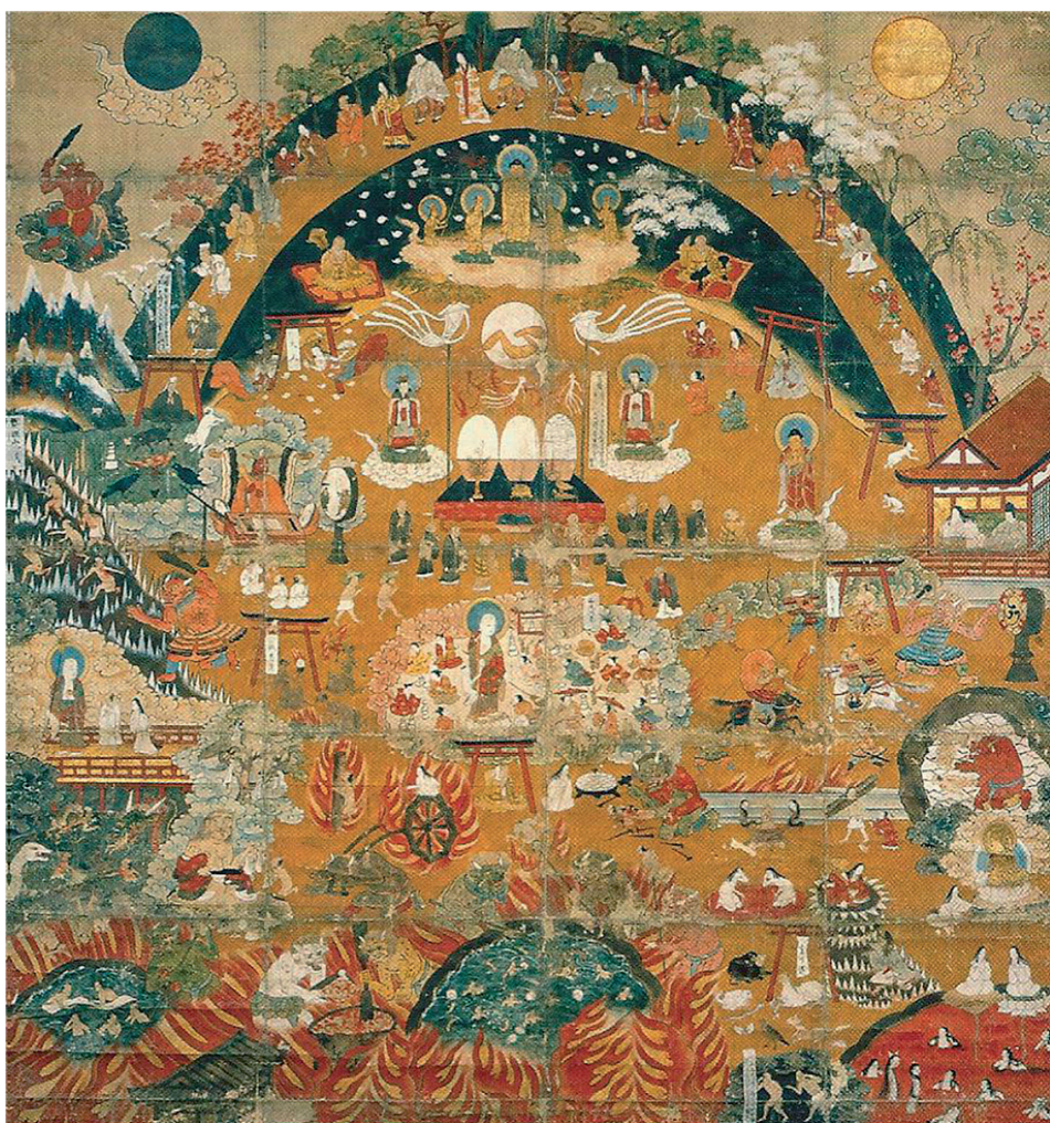
Obr. 3. Kumanská Mandala Desiatich svet

Horná časť mandaly zobrazuje oblúk života, ktorý predstavuje jednotlivé fázy v živote človeka. Jej dolná časť vyobrazuje rôzne buddhistické peklá, do ktorých sa vchádza šintó bránou torii zároveň označujúcou vstup do svätyne božstiev kami . V strede mandaly je umiestnený jej hlavný odkaz: (1) buddhistický oltár, na ňom obetiny slúžiace k nasýteniu zosnulých bytostí a hladných duchov, nad nimi (2) japonský znak pre srdce – kokoro • 心 – ktorý označuje stred, láskavosť, súciti a empatiu, a (3) tesne pod oblúkom života stojí buddha Amida pripomínajúci možnosť znovuzrodenia v Západnom raji blaženosti.