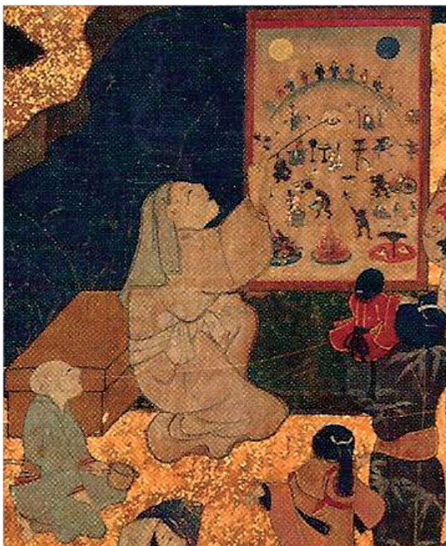
Obr. 2. Kumanská mníška a jej pomocníčka

perá, na detaily príbehu pred nimi, ktorý približovali svojim poslucháčom. Obvykle ich sprevádzala mladá mníška-pomocníčka, ktorá medzi obecenstvom posielala naberačku s dlhou rúčkou a zbierala príspevky na opravu a údržbu chrámových budov na horách v Kumane. 101