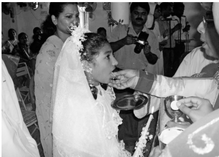
Obr. 3: První svaté přijímání s podáváním do úst.

Církev vzešlé z reformace přišly s odlišnými interpretacemi eucharistie (protestanti hovoří spíše o Večeři Páně), než jaká byla obvyklá ve středověkém západním křesťanství, a některé začaly Večeři Páně začleňovat do bohoslužeb vzácněji, třeba jen několikrát do roka.