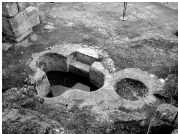
Obr. 2: Křestní nádrž baptisteria v Emauzích-Nikopoli (Izrael) ve tvaru kříže se schody k sestupu do vody.

Od 4. století se ke křtění začala využívat baptisteria , stavby s centrálním půdorysem, v jejichž středu se nachází vodní nádrž, kde se konalo ponožování. Při křtu asistovali jáhni, případně jáhenky. Křtěnec se po křtu oblékal do bílého oděvu na znamení očištění od hříchů.