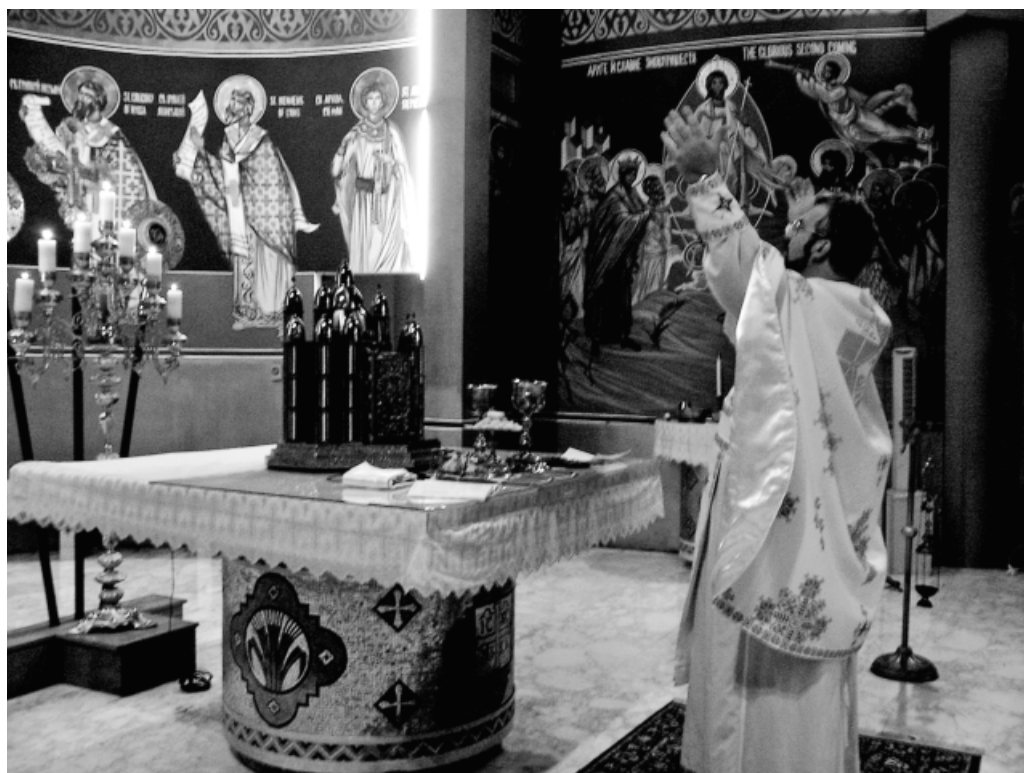
Obr. 4: Moderní oltář v řeckokatolickém Chrámu sv. Josefa v Chicagu.

Již byla zmínka o specializovaných stavbách určených k provádění určitých rituálních celků: o kostelech (chrámech), kde se odehrává bohoslužba, a baptisteriích, kde se (převážně v antice a raném středověku, v Itálii ale i za renesance) konal křest. Tyto stavby bývají opatřeny různou výzdobou a mobiliářem , například mozaikami, relikviáři (schránkami s ostatky svatých), sochami či obrazy, které mají přitáhnout pozornost k určitým událostem nebo postavám křesťanství. Významnou součástí vybavení chrámů je oltář , na kterém probíhá eucharistie (Večeře Páně). Některé protestantské církve zavedly místo oltáře jen přenosný stůl, který se připravuje podle potřeby.