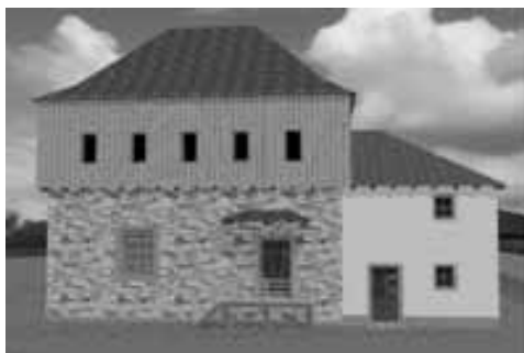
Obr. 5. Srovnání současného stavu tvrze s možnou podobou po rekonstrukci.

Abb. 5. Vergleich des derzeitigen Zustandes der Festung mit möglichem Aussehen nach der Rekonstruktion: oben – Westfassade des Turms, unten – Südfassade mit Eingang in den Turm und den barocken Anbau.