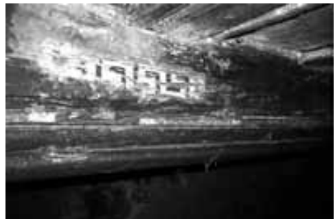
Obr. 3. Hruškově profilovaný trámový strop v mezipatře nosislavské tvrze – na pravém obrázku zbytky původní malby stropu, vlevo pod stropem klenby původního okenního otvoru v severní zdi.

Abb. 3. Birnenförmig profilierte Balkendecke im Zwischenstock der Nosislaver Festung – auf dem rechten Bild Reste der ursprünglichen Deckenmalerei, links unter der Gewölbedecke der ursprünglichen Fensteröffnung in der Nordwand.