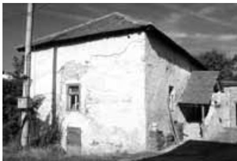
Obr. 1. Zdevastovaná budova bývalé tvrze v Nosislavi. Pohled od západu a jižní pohled ze dvora.