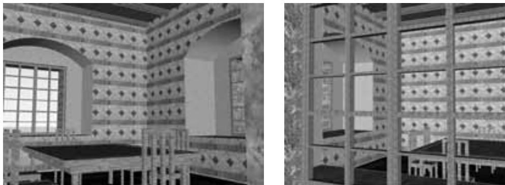
Obr. 4. Dva pohledy do „rytířského sálu“ vzniklého vybouráním příčky a odstraněním sníženého stropu s umístěním oken v původních pozicích dle dochovaných špalet.

Abb. 4. Zwei Ansichten des durch Herausbrechen der Trennwand und Beseitigung der tiefer gelegten Decke entstandenen „Rittersaales“ mit Anordnung der Fenster in ursprünglicher Position gemäß den erhaltenen Laibungen.