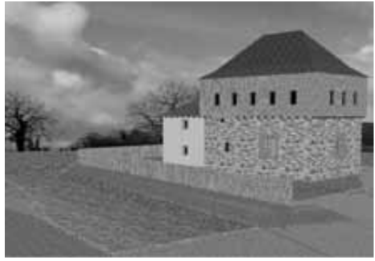
Obr. 6. Srovnání současného stavu tvrze s možnou podobou po rekonstrukci. Celkový pohled přes vodní příkop od severozápadu.

Abb. 6. Vergleich des derzeitigen Zustandes der Festung mit möglichem Aussehen nach der Rekonstruktion: Gesamtansicht über den Wassergraben von Nordwesten.