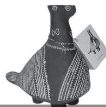
Vučednícká holubica, symbol Slavónie

PANČIČ, K. Kulturno naslijeđe i turizam . Radovi zavoda za znanstveni rad HAZU Varaždin, 2006, br. 16–17, s. 211–236.