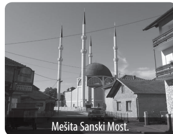
Mešita Samski Most.

Tento text vznikl za podpory grantu GAČR č. P410/10/0136.