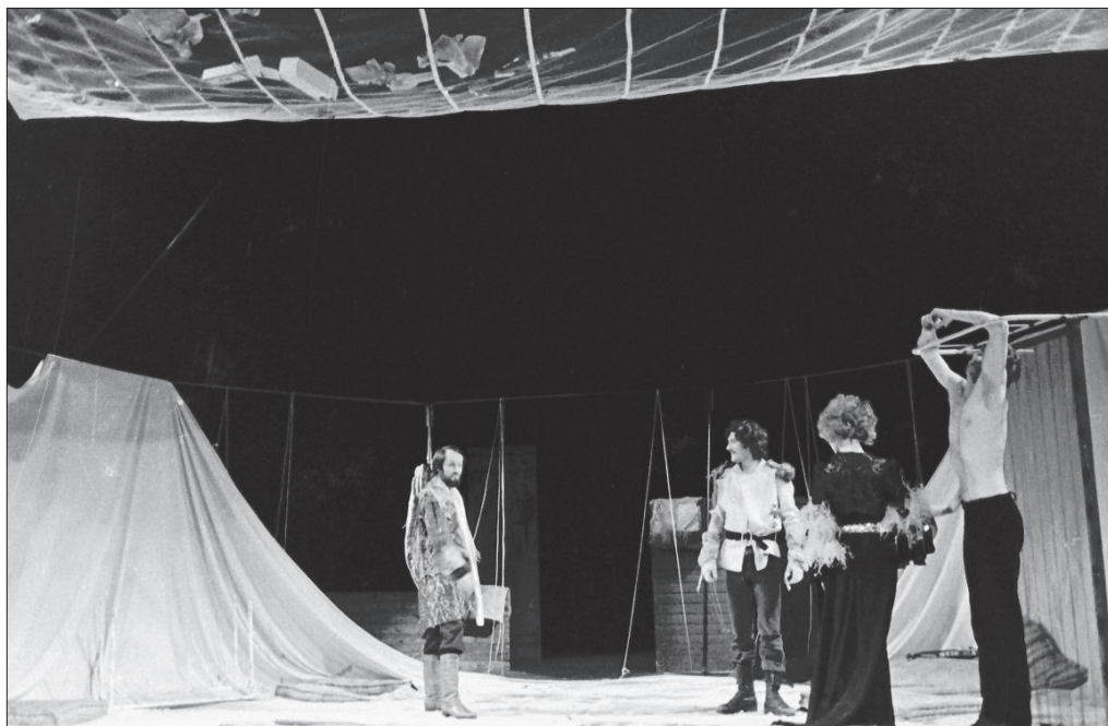
Obr. 7: Hektorova smrt (© Vladimír Svoboda, foto poskytl Divadelní ústav v Praze)