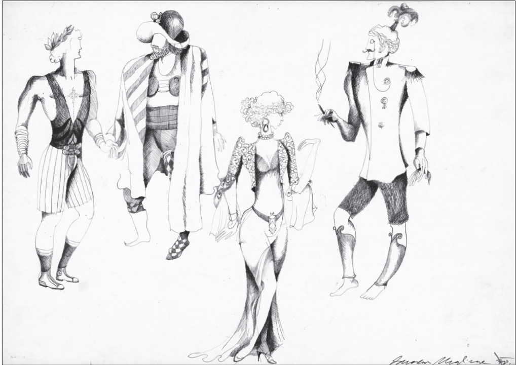
Obr. 1: Kostýmní návrhy k inscenaci (© Jaroslav Malina; zapůjčilo Divadelní oddělení Národního muzea v Praze)

Plynulý pohyb umožňovala Malinova antiiluzivní scéna ostře kontrastující s novobaročným interiérem měšťanského ústeckého divadla. 11 Uvnitř konvenčního divadla vytvořil Malina pomocí bílého plátna velkou oválnou, k divákovi otevřenou manéž. Bílý horizont tak prostor uzavíral a současně i otevíral průhledy do soukromí i do divadelního nekonečna. Jevišťe se tím zvětšovalo nebo naopak zmenšovalo (FRYDLOVÁ 2012: 84). Nad hlavami herců a částečně i nad hlavami diváků byla zavěšena síť, „typický atribut manéže, síť zřejmě dlouho nepoužívaná a proto plná odpadků: cirkus je starý a zchudlý, válka už trvá devět let a bojiště se stává smetištěm“ (ČERNÝ 2005: 74). Pocit cirkusu navozoval i zvuk orchestrionu, který spolu s rykem bojovníků doprovázel celou hru.