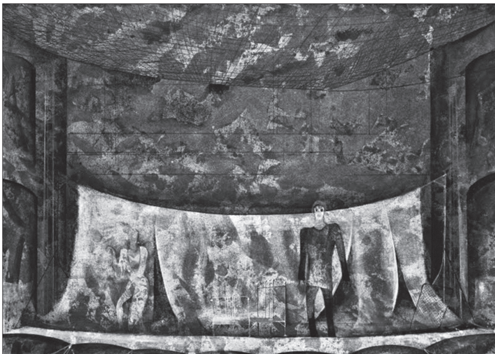
Obr. 4: Scénický návrh (© Jaroslav Malina)

V Jakubovi 13 a Troilovi je vždy zachována realita věci samé: postel je vždy postelí a nikdy nezastupuje třeba stan. Ale způsob nakládání s tou postelí je metaforický: když se železná postel sklapne, nestává se sice vězením, ale když dva milenci k sobě nemůžou skrze mřížoví oné postele, tu se stává metaforou, zmnohonásobuje se její význam, věc tu prostě dostává nové funkce – aniž přestává být sama sebou. (RAJMONT 2005: 88)