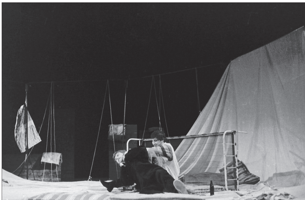
Obr. 6: Hektorova smrt (© Vladimír Svoboda, foto poskytl Divadelní ústav v Praze)