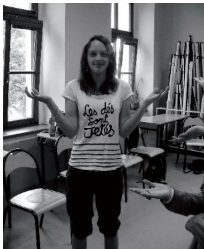
Obrázek 3 Kníže (první alternativa)

Jako příklad procesu osvojování dovedností divadelního vyjádření uvádíme obrázky 3 a 4 – fotografie exprese ztvárnující autorskou představu obecného pojmu „kníže“ – vládce, panovník. 26 Prozkoumejme nejprve obrázek 3.