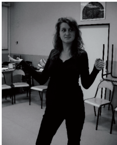
Obrázek 4 Kníže (druhá alternativa)

Dívka na obrázku 4 zřetelně odlišila gesto pravé ruky od ruky levé. Tím podněcuje diváka k hledání vhodné interpretace v historickém kontextu pojmu „kníže“ – panovník, k němuž se tato exprese vztahuje. Nabízí se výklad, že dívka drží symboly moci: v levé ruce žezlo, v pravé jablko. V této fázi programu klademe důraz na rozvoj schopnosti přiléhavé expresivní symbolizace, nejde nám ještě o přesná historická fakta. Proto žezlo a jablko chápeme jako obecné symboly vladařské moci, nepátráme po časovém rozmezí jejich užívání. Výraz dívky je soustředěnější než v předchozím případě. Pohled stranou je upřený jakoby do dálky a doprovází jej střídmý úsměv. Dá se vyložit jako výraz typický pro portréty vladařů, mají-li u portrétovaného vystihnout schopnost státnické vize. Také držení těla lépe odpovídá typickému postoji středověké sochy.