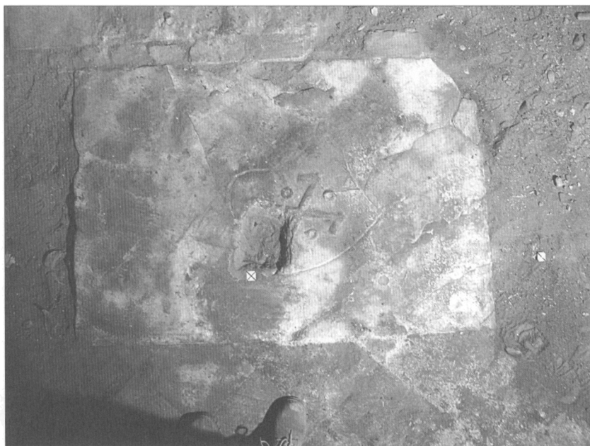
Obr. 2. Náhrobní deska s renesančním kolčím štítem.

Popsaná situace v západní části chrámu se dnes výrazně liší od východní partie, kde proběhl v 50. letech minulého století hloubkový archeologický výzkum. Publikování výsledků archeologického výzkumu ve východní části klášterního kostela sv. Anny se v minulosti logicky soustředilo na prezentaci tehdy odkryté rotundy a templářského kostela sv. Vavřin-