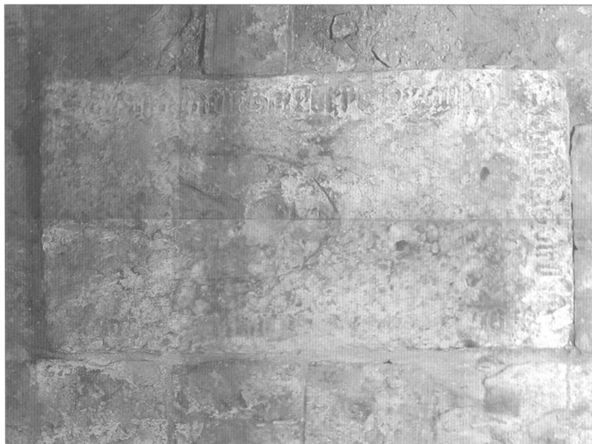
Obr. 3. Náhrobní deska s erbem s nezřetelným erbovním znamením a opisem gotickou minuskulou.