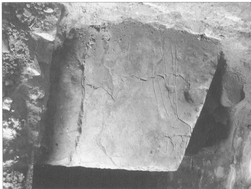
Obr. 5. Torzo náhrobní desky z jižního ramene ambitu, vlevo keramické dlaždice.

Ostatní náhrobníky náležejí již k pohřbům významných měšťanů nebo měšťanských rodů. Druhý exemplář desky nad hrobkou je vytesán ze sliveneckého mramoru a má dochovaný rozměr 143×90 cm při síle desky 11 cm, při čemž šířka je kompletně dochovaná. Uražená horní část obsahuje část nápisu humanistickou majuskulou s datem 1602, ve spodní partii je štípený erb s polovinou orlice v pravé části a trojicí břeven v lehkém pokosu v levé. Podle erbu se jedná o rodový znak Turků z Rozenthalu v provedení před jeho polepšením v roce 1649 (Fiala–Hrdlička–Županič 1997, 121–124, obr. 88), tedy ve formě, kterou známe i z nedávného nálezů torza malované láhve, pocházející z domu U Vejvodů, sídla tehdejšího staroměstského primátora Mikuláše Františka Turka ze Šturmfeldu a Rozenthalu (Dragoun–Dragoun 2005, 107, 109). Dva dochované otvory pro zakotvení úchytů sloužících k vyzvedávání desky včetně žlábků pro zapadnutí k tomuto účelům používaných kovových kruhů jsou v dolní části náhrobníku, zbývající dva byly zjevně v nyní odlomené partii. Ani tato deska svými rozměry neodpovídá zmíněné kryptě v rohu lodi.