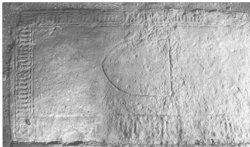
Obr. 4. Náhrobní deska s erbem a gotickým minuskulním opisem.

ce. U severní zdi gotického chrámu byly při výzkumu v roce 1954 konstatovány dokonce 3 různé dlažby, dvě spodní cihlové a horní opuková a pískovcová. Nejstarší z nich byla kvalifikována jako nejstarší dlažba anenského kostela po jeho výstavbě (Borkovský 1957a, 10n). Popis pokračujícího výzkumu v roce 1956 hovoří o pouze lokální existenci jediné dlažby, složené z pálených dlaždic formátu 20×20 a 28×28 cm a dále o použití opukových, pískovcových a mramorových desek, snad pocházejících původně ze zbytků náhrobních desek nebo z obložení hrobek. Tato dlažba je označena za renesanční nebo barokní a již před výzkumem byla historickými stavebními zásahy na většině zkoumané plochy odstraněna