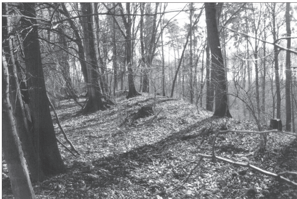
Obr. 3. Údajný val hradiùtù nebo lineárního opevnění na hraně Zemanovy stráÙe.

Abb. 2. Hohlweg im Kataster Èistá (Lauterbach), von den Deutschen Alte StraÙe und von den Tschechen Voùtice genannt.