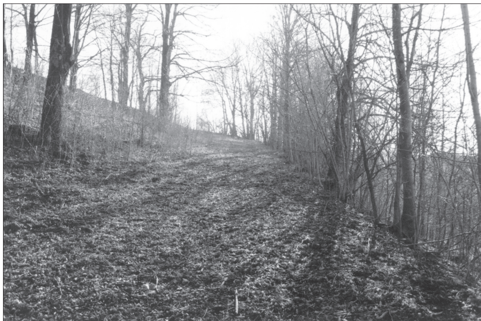
Obr. 5. Rampa k silnici do Litomyšle.