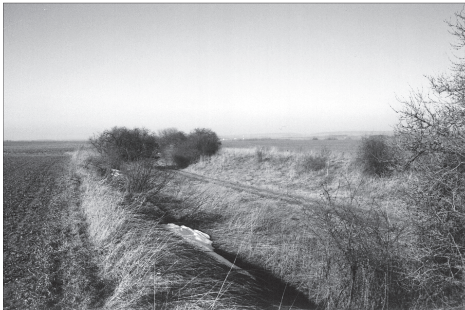
Obr. 2. Úvoz na katastru Čistě, nazývaný Němci Alte StraÙe a Èechy Voùtice.

Abb. 2. Hohlweg im Kataster Èistá (Lauterbach), von den Deutschen Alte StraÙe und von den Tschechen Voùtice genannt.