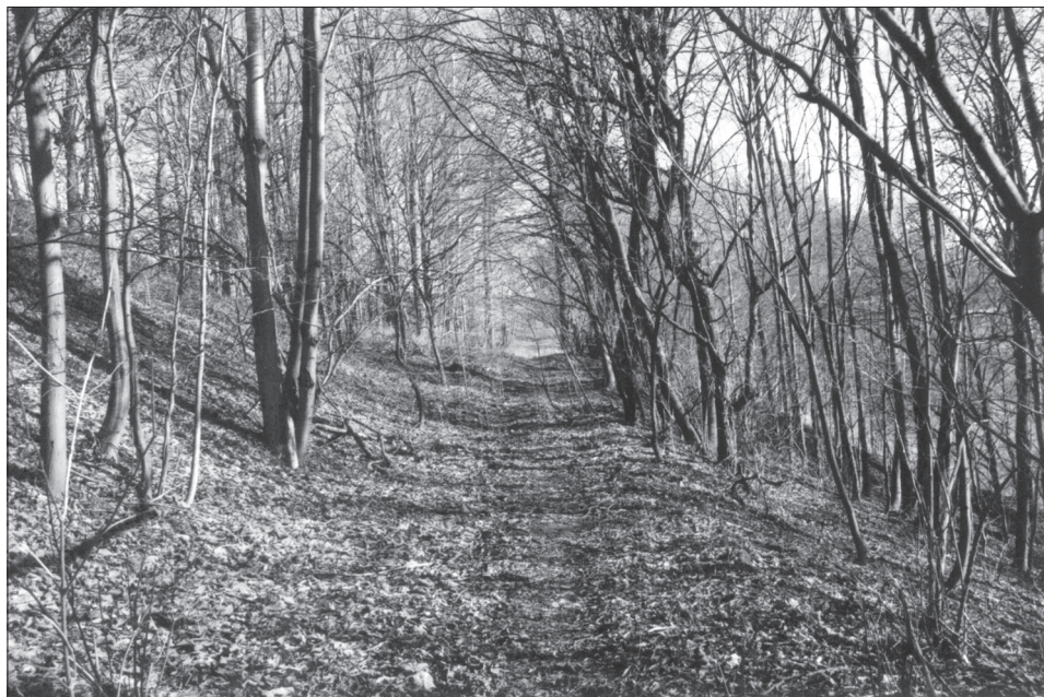
Obr. 4. Rampa v severním svahu Jiráskova údolí.