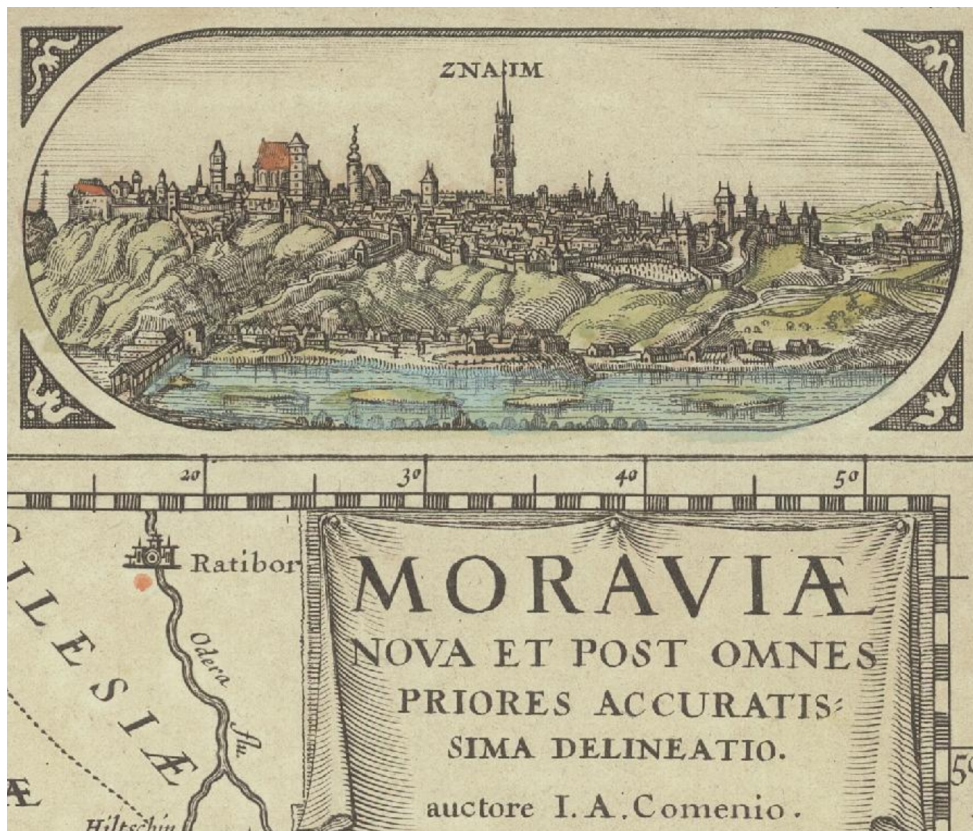
Obr. 4 Veduta Znojma jako doplněk samostatné mapy Moravy od J. A. Komenského

obsahovalo možnost rozpisu periodika či knihy a jednotlivých kapitol. Nyní je umožněn rozpis vedut pod zkratkou rg (rozpis grafiky), ale i map a atlasů pod zkratkou rk (rozpis kartografických dokumentů). Prozatím však nebylo rozhodnuto o možnosti importovat tyto záznamy do společné databáze ANL.