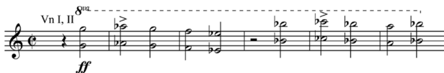
Př. 2 První věta, t. 111–116.