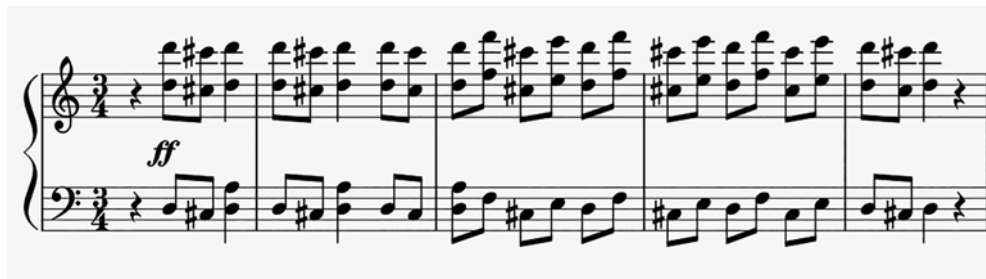
Př. 8 Hlavní téma (rytmický motiv) v orchestrální introdukci (od t. 1).

Hlavní téma zazní v introdukci Allego sostenuto (takt 1). Je v 3/4 taktu, motorické, d moll. Zcela zásadní pro další identifikaci v hudebním zápisu je jeho rytmická figura složená ze dvou osmin a jedné čtvrté noty (1-1-2):