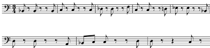
Př. 3 Druhá věta, téma Ciaccony.

Jednotlivé variace dílu probíhají nad osmitaktovým melodickým tématem v basu, které zůstává stále stejné.