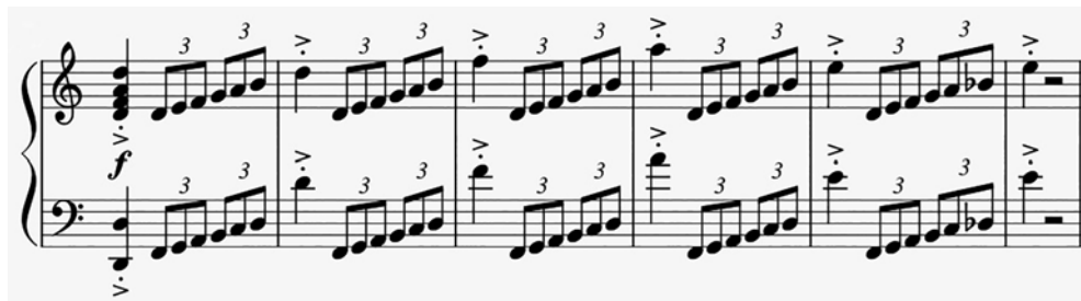
Př. 9 Klavírní část hlavního tématu, t. 32.

V t. 32 (Allegro con spirito) se k orchestrální figuře přidá sekvencovité téma klavíru v d moll. Přitom není jasné, zda se jedná o samostatné téma, nebo klavírní součást tématu.