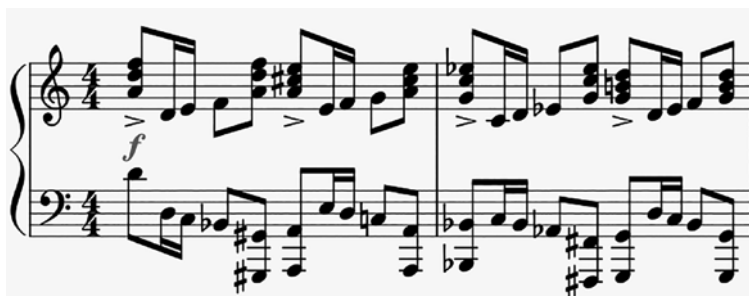
Př. 13 Rytmické téma (t. 7).

Rytmické téma pokračuje synkopickými plochami v d moll (t. 17) a v B dur ve smyčcích (Vn – Cb, t. 35). Naposledy se rytmické téma 2–1–1 v klavíru objeví v C dur v t. 70.