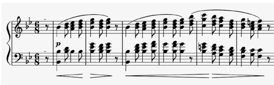
Př. 12 Andante pastorale – úvod 2. věty.

Proti němu je postavena hybná kontrastní sarkastická pasážová plocha v b moll, od t. 51. V t. 66 se navrácí pastorální téma v C dur. Klavír ovšem proti němu staví rychlé triolové figurace. Takt 89 přináší akordické skoky klavíru proti šestnáctinovým pasážím orchestru. Pastorální téma v B dur se opět vrací v t. 142.