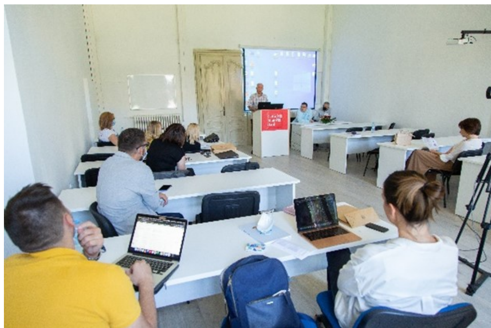
S rada kulturološke sekcije