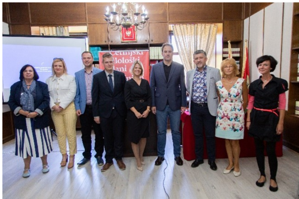
Dio učesnika u sekciji za jezikoslovlje