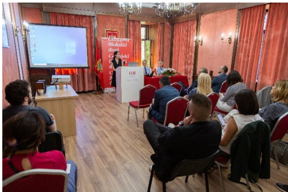
S rada sekcije za književnost