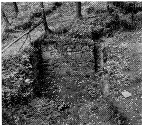
Obr. 3. Odkrytý polopiliř parkánové zdi pro bývalý most.

i sídelních objektů, dále na východ. S podhradím byl hrad spojen ještě jinou, dnes dobře patrnou cestou, vedoucí přímo podél šíje ostrožny.