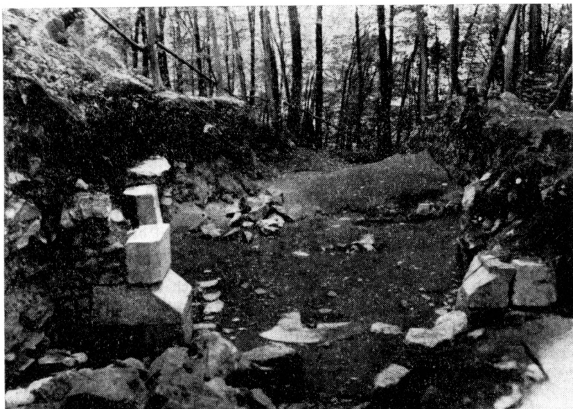
Obr. 4. Odkryv hradní brány – pohled od východu (foto A. Kříž).

né časové zařazení dále potvrzují numismatické nálezy z areálu hradu, mj. též unikátní víčko schránky na brakteáty. 20