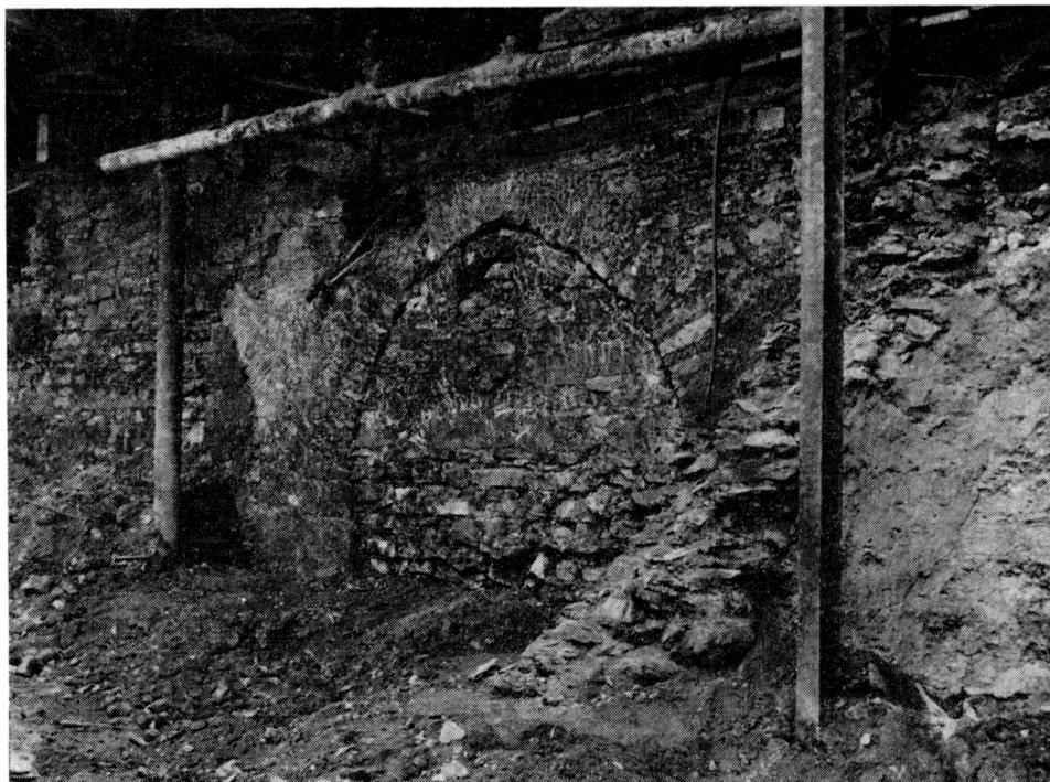
Obr. 2. Čelo kamenného mostku přes polozasypaný příkop. Celkový pohled na stav po obnažení. V pravém dolním rohu maninská štěrkopísková terasa, vlevo od ní pískové vyklínění a dále vlevo řez břidlicovou opěrnou zdí příkopu. Ve středu snímku plně zachovaný oblouk mostního čela a pilř mostku se zbytky omítky. V líci čela mostku dosud patrná zadržívka sklepního prostoru. Pod vrcholem oblouku sonda do zadržívky sklepního vhozu. Památka bude prezentována bez zadržívky sklepního prostoru, za kterou bude viditelná základová zeď domu čp. 380.