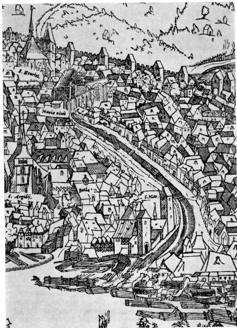
Obr. 3. Praha v roce 1562. Výsek z prospektu Praga Bohemiae Metropolis Accuratissime Expressa . Část Starého Města mezi Vltavou a hradbou Nového Města pražského. V levém horním rohu znázorněn kostel sv. Jindřicha, pod ním vpravo zříceniny kostela P. M. Sněžné a odtud se táhne příkop mezi oběma městy až k řece. V pravém dolním rohu dnes stojí Národní divadlo.

Zachované torzo můstku uniklo zboření při výstavbě nového domu čp. 380/I v polovině 19. století tím, že novostavbu posunuli na nově vyměřenou uliční čáru po roce 1841, která navázala na nároží domu čp. 382/I, aby se přizpůsobila nové ose jižní části ulice Na můstku. Proto základy nového domu a jeho sklepy postavili až za východním průčelím mostku do dokonale konsolidovaného násypu příkopu, když před tím zbořili zbytek mostního oblouku, pilíře i opěrné břidlové zdi příkopu. Polohu domu čp. 380/I, který postavili na mostek po zru-