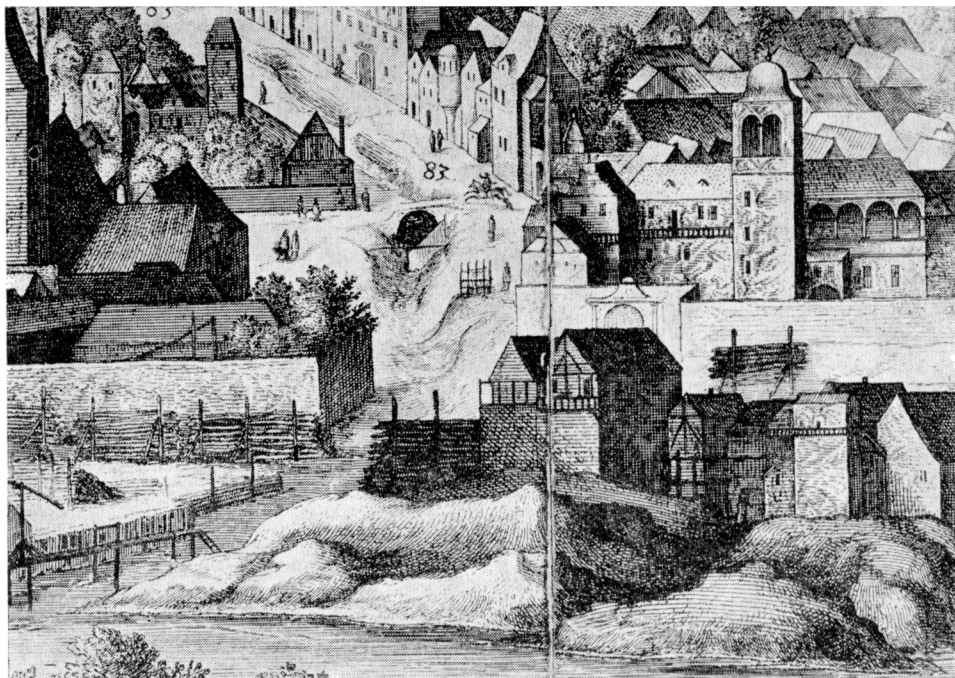
Obr. 4. Praha v roce 1606. Výsek ze Sadelerova prospektu. Pohled na ústí vodoteče do Vltavy severně dnešního městiště Národního divadla.

šení jeho funkce po výstavbě části ulice Na můstku mezi Provaznickou ulicí a Koňským trhem (někdy kolem roku 1463), můžeme názorně vidět na známém modelu Prahy z roku 1830, dnes vystaveném v Muzeu hlavního města Prahy.