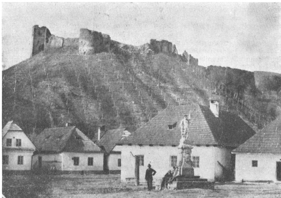
Obr. 1. Hrad Brumov. Celkový pohled z 2. poloviny 19. století.

První pokus o architektonický rozbor hradních zřícenin provedl K. Svoboda. Vycházel podstatnou měrou z práce Prokopovy a na lokalitě samotné provedl jen povrchový průzkum (Svoboda, 1948). V posledních letech došlo ke zvýšení zájmu o samotnou lokalitu v souvislosti s plánem využít areálu hradu ke kulturním účelům. V letech 1972–73 byla nákladem MNV Brumov postavena nová zeď na některých úsecích obvodu hradu (důvodem byla ochrana před padajícím zdivem dosud zachovalých objektů hradu) a zbudována stříška nad zbytky věže na jižním konci hradního areálu.