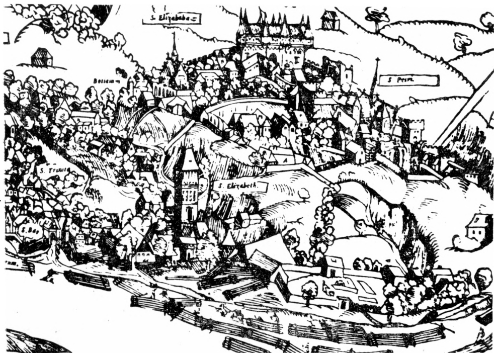
Obr. 2. Výsek z dřevorytu J. Kozla a M. Petrie z Annaberku z roku 1562 – detail vyšehradského hradíště a Podvyšehradí.