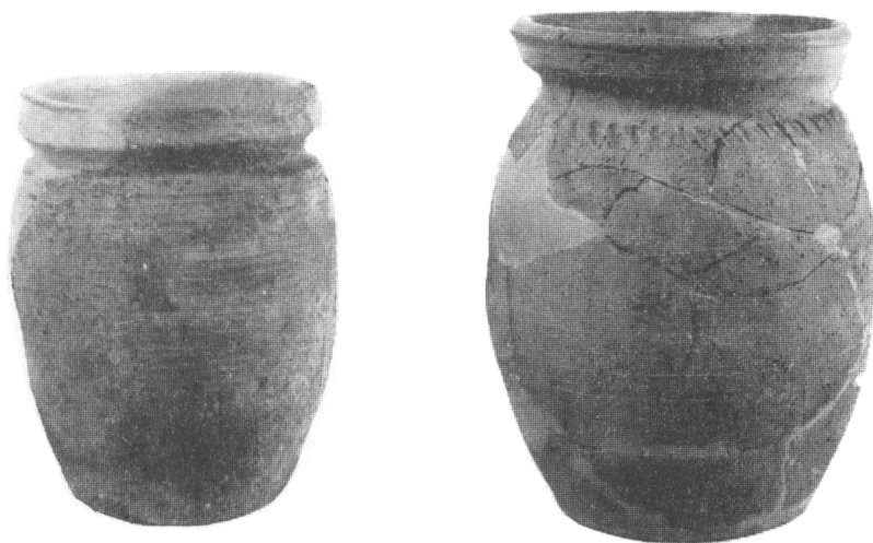
Obr. 2. Keramika z Mohelnice (12. stol.) a Loštic (13. stol.).

V průběhu 13. stol. došlo také k výrazným změnám v půdorysném uspořádání vsí. Zde jsou naše poznatky torzovité, neboť žádná osada není doposud prozkoumána vcelku. Pouze na sídlišti v Paloníně se podařilo zachytit uskupení objektů, které považujeme za usedlosti. Předpokládané sídlištní jednotky byly volně rozmístěny na ploše bez jakéhokoliv uspořádání. Obytná část osady v Mohelnici nebyla zachycena, pravděpodobně jen několik obytných domů bylo rozmístěno mezi výrobními objekty. V Rýmařově se podařilo odkrýt řadu za-