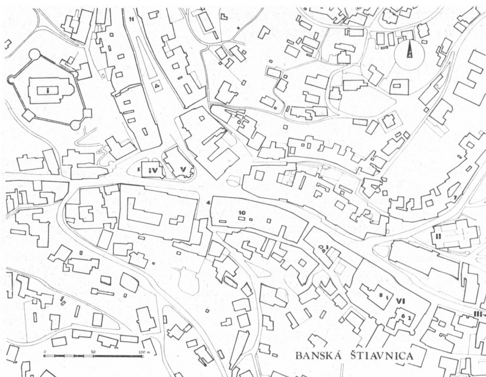
Obr. 1. Plán časti historického jadra B. Štiavnice. Vykresil D. Tóth.