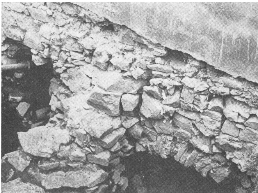
Obr. 3. Východná strana opevnenia Trojičného námestia.