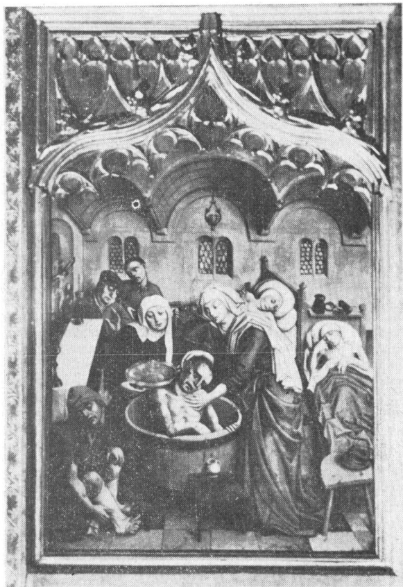
Obr. 3. Košice, dóm sv. Alžběty, jedna z desek pozdně gotického křídlového oltáře s vyobrazením interiéru románského domu.

Import středomořských stavebních zvyklostí do našich poměrů známe pro sledo-