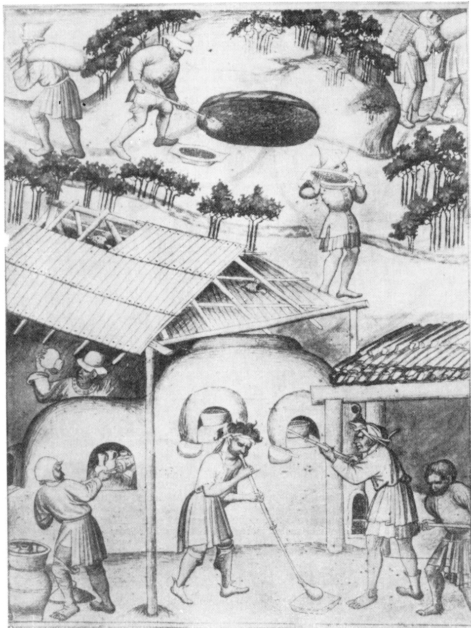
Obr. 3. Mandevillův cestopis, kolem r. 1420, f 6r , provoz u sklářské pece.