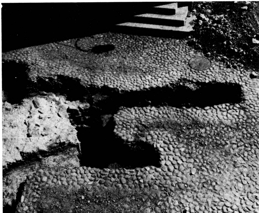
Obr. 5. Zvolen — zámok. Základy múru pôvodného opevnenia a oporného pilleru č. 2.