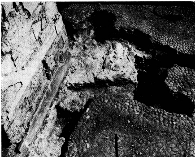
Obr. 2. Zvolen — zámok. Južná stena kaplnky s poryným pilirom č. 2 a so základmi č. 6.