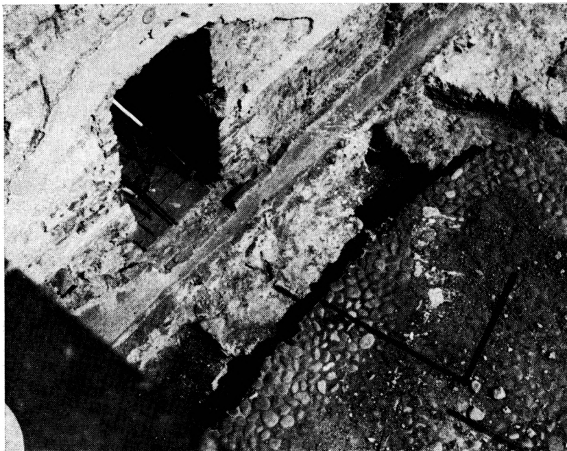
Obr. 1. Zvolen — zámok. Južná stena kaplnky s opornými piliermi č. 1 a 5.