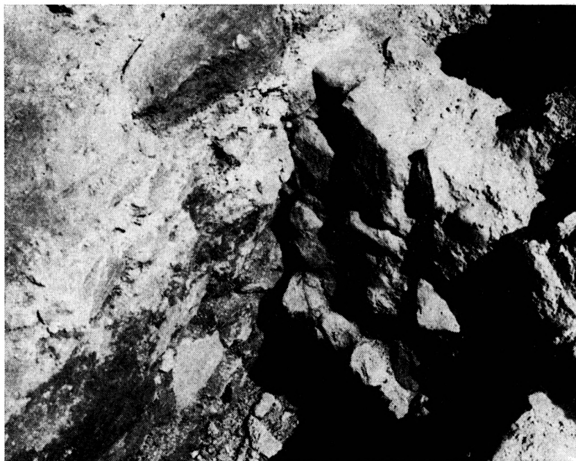
Obr. 6. Zvolen — zámok. Styk základov oporného pilleru č. 2 a základov opevnenia.