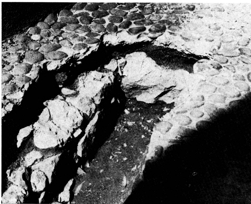
Obr. 4. Zvolen — zámok. Styk základov pôvodnej čelnej steny polygónu a základov oporného piliera č. 4.