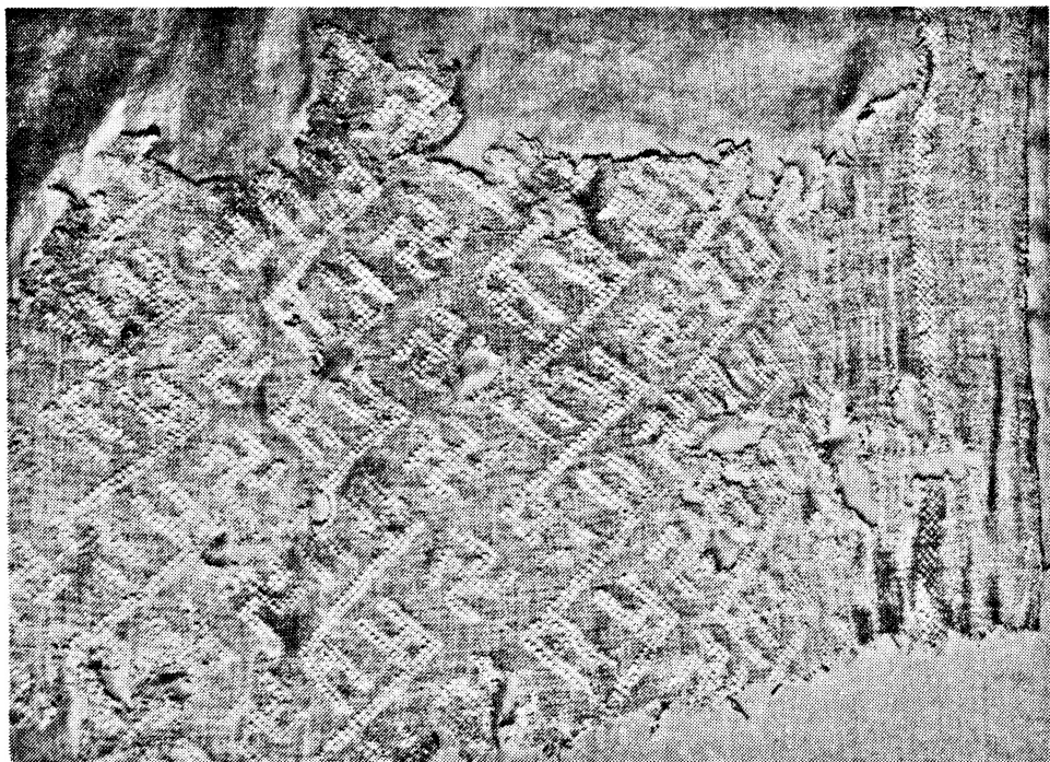
Obr. 3. Lněná tkanina (snad závoj) vzorovaná brošováním z hrobu sv. Ludmily. Evropa, 10. století.