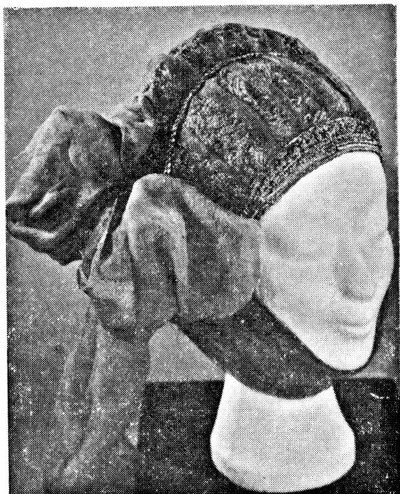
Obr. 2. Čepce Anny Jagellonské, před rokem 1547.

Nadzemní část královské hrobky zhotovil v renesanci nizozemský sochař A. Collin. Mramorovou tumbu zdobí ležící postavy císaře Ferdinanda I. Habsburského, jeho choti Anny Jagellonské a syna Maxmiliána II., jejichž pozůstatky byly do mauzolea přemístěny v r. 1590. V souvislosti s restaurováním této památky byl v roce 1974 podniknut i výzkum tumb, odkud byly vyzvednuty a předány ke konzervování a restaurování pohřební textilie panovnické rodiny (obr. 2). Současně byl restaurován oděv Rudolfa II. a Marie Amálie, jejichž