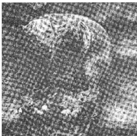
Obr. 3.1. Zklamaný lev nad vladislavským emblémem ze Staroměstské radnice v Praze.