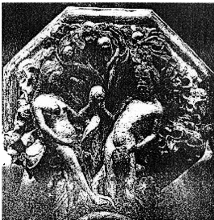
Obr. 6. Konzola s Adamem a Evou v chóru katedrály sv. Víta v Praze, 1390–1400.