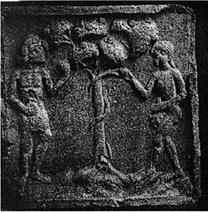
Obr. 4. Kachel s Adamem a Evou u stromu poznání, Brno – 2. pol. 15. století.