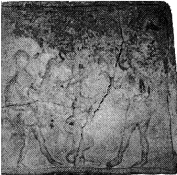
Obr. 5. Kachel s Adamem a Evou u stromu poznání, Brno závěr 15. až počátek 16. století.