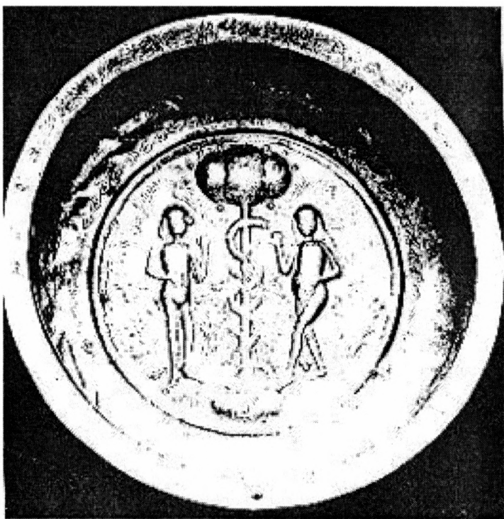
Obr. 7. Mosazná tepaná a ražená mísa ze začátku 16. stol. s motivem Adama a Evy u stromu poznání s mluvčícími páskami a se značkou kovotepce. Průměr 24 cm, Norimberk, majetek Uměleckoprůmyslového muzea v Praze.