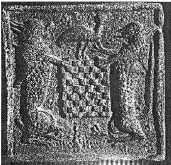
Obr. 9. Kachel s výjevem dvou šelem (líšky a vlka?) a se znakem kožešnického cechu, Brno, náměstí Svobody – 15. století.

I tento motiv nebyl doposud dostatečně vysvětlen po stránce ikonologické, a tak i tento příspěvek je možné chápat jako nástin hlavních směrů, jimiž by se měl následující vý-