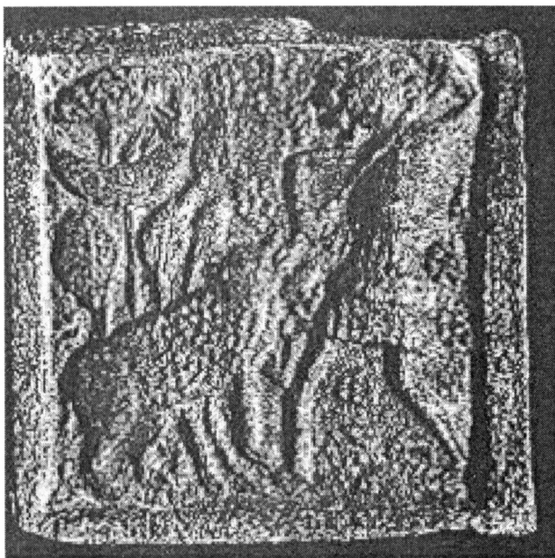
Obr. 8. Kachel s motivem lovu zvířete s přidavným zobrazením pelikána na hnízdě, Brno – snad 1. polovina 15. století.

V souvislosti se zde prezentovanými narativně podanými náboženskými náměty je třeba se zmínit i o tématu pelikána krmícího vlastní krví svá mláďata , který se v brněnském kachlovém materiálu objevuje jednak samostatně a to již v renesančním podání (v medailónku), ale i ve spojitosti s další scénou: lovu divokého zvířete (obr. 8). Jako přidavnou scénu zaznamenává pelikána na hnízdě i Z. Hazlbauer (1991) a to k motivu Adama a Evy z hradu Boleslavice nad Prosnou.