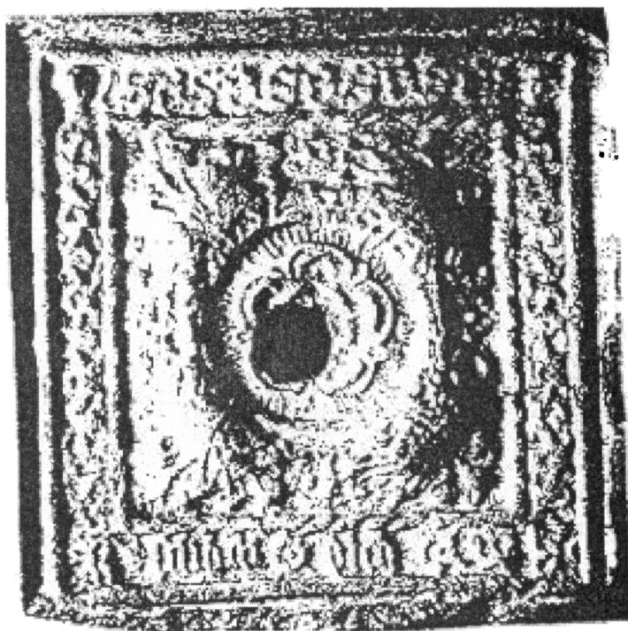
Obr. 2. Kachel s rozetou, budínský typ číslo 16, nález z Vyškova.