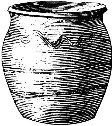
Obr. 2. Středohradištní nádoba z nálezů v Jevíčku (podle nálezové zprávy).

východně od obce Křenova pod mařínským hradištěm, náležely slovanskému osídlení. Týž autor se zmiňuje rovněž o dalších nálezích pocházejících z mařínského hradiště, jako o zuhelnatělých kolících, dále o kopí, tříhroté sekerce(?) a kladivu s knoflíkem. Zejména na základě starších nálezů keramiky usoudil rovněž H. Weinelt 8 v roce 1937, že rozsáhlý komplex hradiska je slovanským objektem.