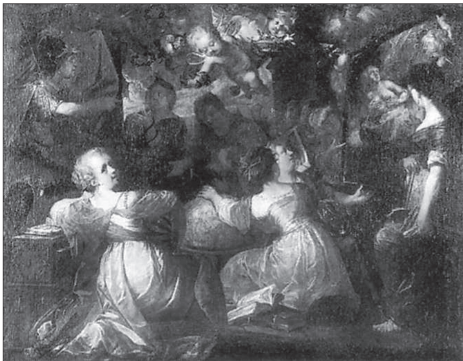
9. Johann Hulsman, Minerva als Beschützerin der freien Künste Köln, Wallraf-Richartz-Museum