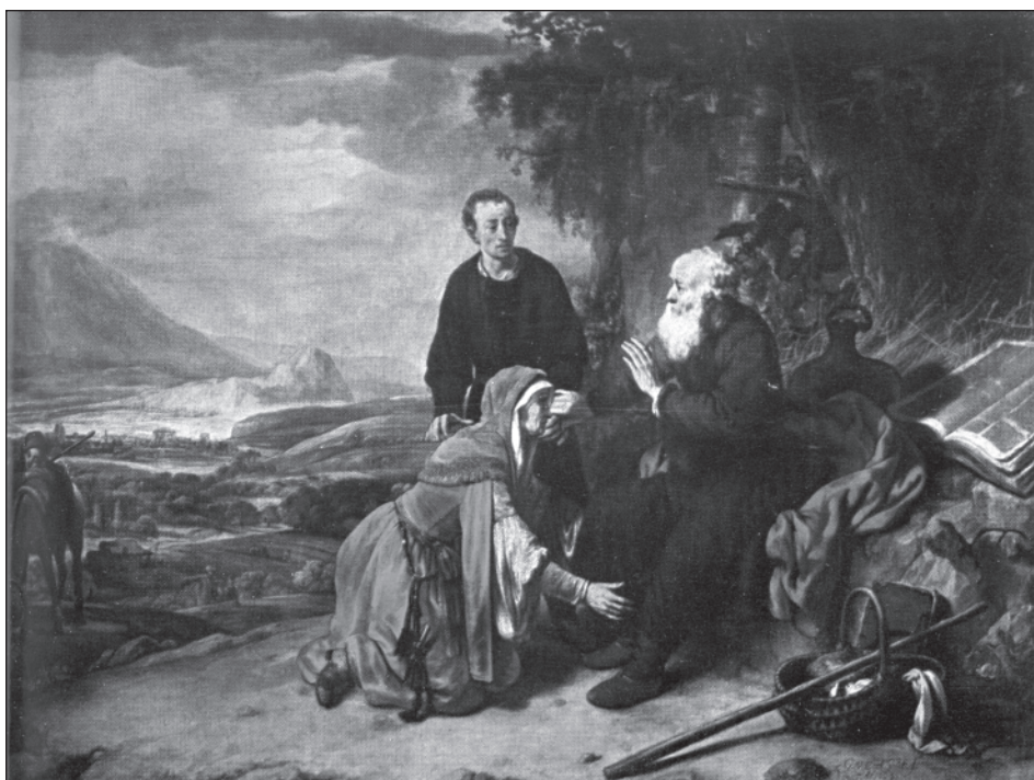
8. Gerbrand van den Eeckhout, Der Prophet Eliseus und die Sunamitin, 1664 Budapest, Szépművészeti Múzeum.