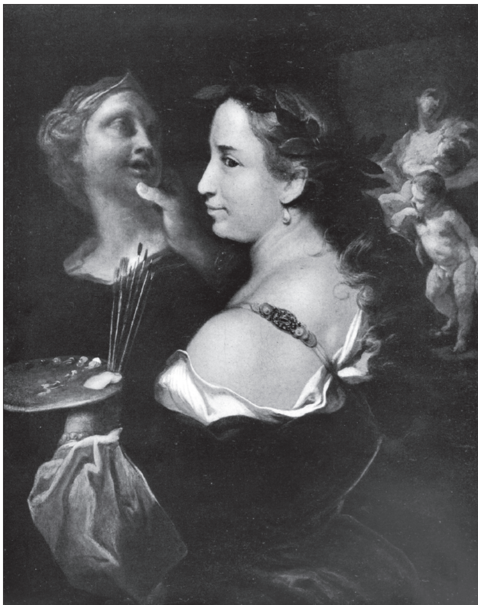
10. Johann Kupezky, Personifikation der Malerei, nach 1709 Prag, Národní galerie v Praze