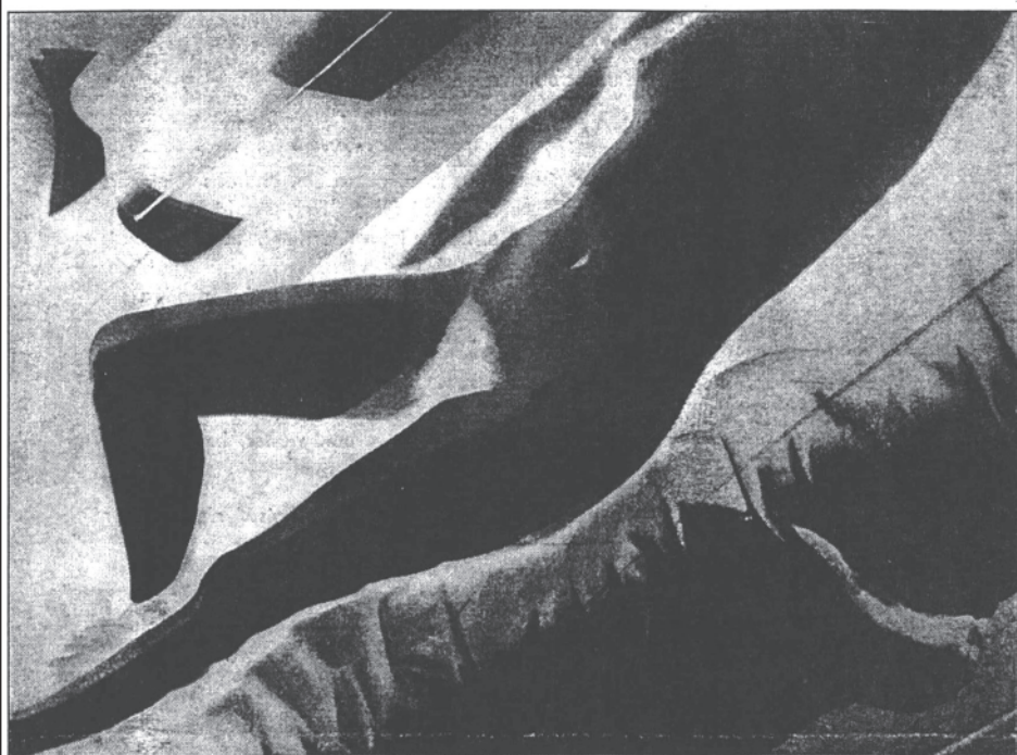
l. moholy-nagy: akt (fotonegativ)