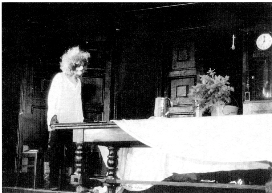
1. Panna a Netvor čili Pohádka pro škařené děti (1991) – Jan Zrzavý