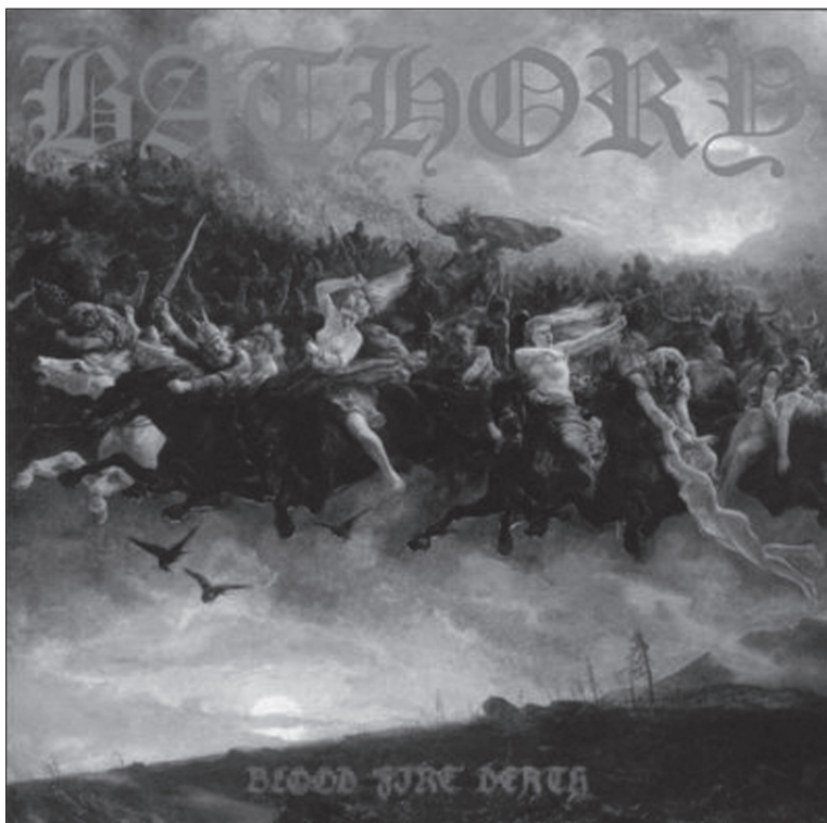
Obr. 4. Album: Blood, fire, death (Bathory 1988)

Satanismus (z počátku spíše jako téma, než jako vlastní religiozita a ideologie) se stal součástí hard rockové a poté metalové scény s příchodem hudební skupiny Black Sabbath včele s Ozzym Osbournem již koncem 60. let 20. století. V nastolené linii užívání satanského tématu se, ať už přímo (např. King Diamond ), nebo pouze