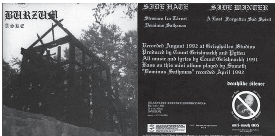
Obr. 7. Obal mini LP: Burzum – Aske (1993)