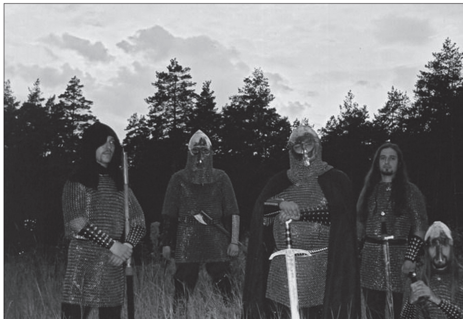
Obr. 8. Ukrajinská NSBM skupina Nokturnal Mortum

Z Vikernesova ultrapravicového odkazu vzniká od poloviny 90. let také nová odnož BM nazývaná nacionálně socialistický black metal, která se již k ultrapravicové ideologii otevřeně hlásí. Díky NSBM kapelám došlo k propojení