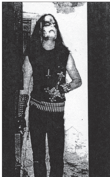
Obr. 5. Euronymous

Zásadní roli v druhé vlně BM metalu sehrála norská skupina Mayhem (vznik 1984), jejíž členové se stali významnými aktéry v řadě násilných činů včetně vypalování kostelů. Skupina byla známa svými extrémními satanistickými postoji a projevy. Především pak „mozek“ kapely, kytarista Euronymous ( Oystein Aarseth ), a zpěvák Dead ( Per Yngve Ohlin ), který roku 1991 ve věku 21 let spáchal sebevraždu (Moynihan – Soderlind 1998: 62).