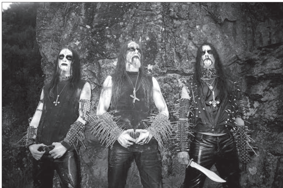
Obr. 1. Příklad BM image – norská skupina Gorgoroth .