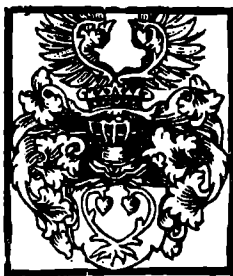
56. Erb LEKNA (páni z Kounic, Martinic aj.)

nezaznamenal. Je dosti pravděpodobné, že jde o pověst německého původu, vzniklou u rodu Zejdlců. 237 Bechyňové měli později erbovní pověst jinak motivovanou, jak uvádí F. Menčík, který se však domnívá, že výše uvedená pověst Paprockého je odvozena z okruhu pověstí, vztahujícím se k dobývání Milána ve 12. století. 238 Menčíkova domněnka, týkající se i dalších znaků, nemusí být správná, protože se jedná o obecné pověsti, jež se vůbec nezařazují do určité doby. 239 Paprocký je také všechny položil do doby dávných slovanských králů. Některé si snad vymyslel sám, i když je vytvořil ve shodě s obecným názorem své doby.