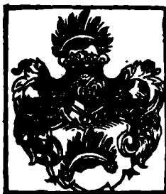
8. Erb KŘÍDLO (páni z Lomnice)