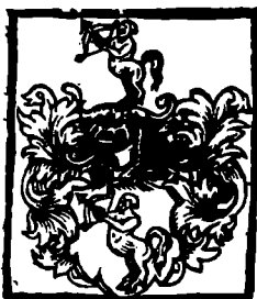
25. Erb KENTAUR (Nekšové z Landeka)

a to až z poslední doby. Neví ani, jak dávno náleží erb tomuto rodu, a podotýká, že nemůže nalézt žádné paměti o rodu na Moravě, protože Petřvaldští mívali statky ve Slezsku. Pro Paprockého autorství svědčí i lokalizace pověsti do dávných dob a do „Slavácké země“ a rovněž to, že motiv páva v erbu k počtě Junony se objevuje i v jiných pověstech vytvořených Paprockým (č. 11 — pov. B, č. 45). Tuto pověst nelze tedy považovat ani za lidovou, ani ji chápat jako šlechtický folklór. Odpadá tak jeden z dokladů inspirace našich erbovních pověstí klasickými motivy.