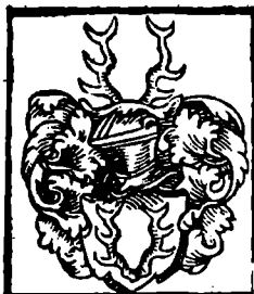
47. Erb JELENÍ PAROHY (Pražmové z Bílkova)

Závěrem je nutno upozornit, že s českým dávným rodem Vršovců souvisí přímo ještě pověst o erbu sekery (č. 20) a nepřímo také pověst o erbu ostrve (č. 6).