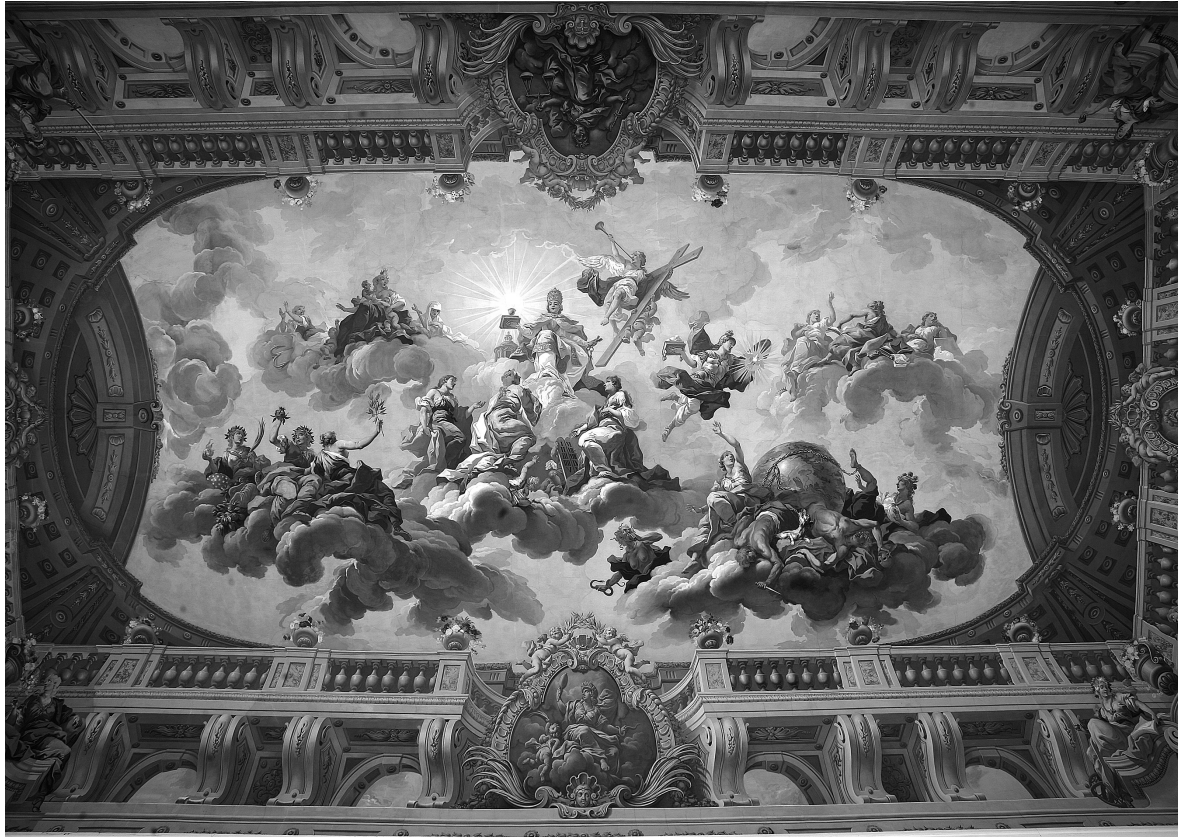
Abb. 2: St. Florian, Augustiner Chorherrenstift, Sommerrefektorium, 1731, Deckenspiegel.

kniend die drei Mönchs- bzw. Ordensgelübde (von links nach rechts): „Armut“ (in einem geflickten Kleid), „Keuschheit“ (über dem Amorknaben triumphierend) und „Gehorsam“ (mit den Gesetzestafeln) [Abb. 3]. Die übrigen Personifikationen sind – analog zum Kompositionsprinzip des Deckenfreskos der Stiftsbibliothek 13 – dieser Zentralgruppe zu- bzw. untergeordnet: Zur Rechten der Papstkirche sitzen die drei „Theologischen Tugenden“ nach 1 Kor 13, 13 (von rechts nach links) „Glaube“ (verschleiert mit Kreuz), „Liebe“ (mit drei Kindern und einer Flamme auf dem Kopf) und „Hoffnung“ (in Bittgestus und mit Ankerattribut). Zur Linken der Papstkirche thronen auf einer Wolkenbank (von links nach rechts) „Demut“ (himmelwärts weisend