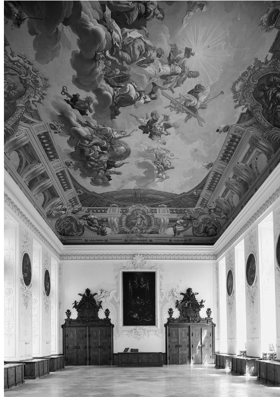
Abb. 1: St. Florian, Augustiner Chorherrenstift, Sommerrefektorium, 1731, Gesamteinblick nach Osten.

der Wände und der Fensterlaibungen schuf Franz Josef Holzinger im Jahr 1731, die Möblierung ist ein Jahr später entstanden. 10