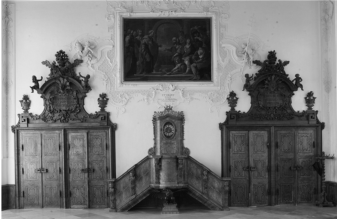
Abb. 4: St. Florian, Augustiner Chorherrenstift, Sommerrefektorium, 1731, westliche Schmalseite.

Thema im Vertrag genau bestimmt war und auch in der Umsetzung minutiös eingehalten wurde: „[...] In der Mauer über dem ersten Sitz ein großes Bild aus der Geschichte der Apostel: an 4. Capitel, 34 V. 35. Vers: so viel ihrer waren die Äcker oder Häuser Hatten, die verkauften sie und brachten das Geld der Güter, die sie verkauft hatten, und legten es vor die Füße der Apostel mit der Inschrift. Et erant illis omnia communia act. 4: V. 32. [...] “ 17 [Abb. 4]. Der „erste Sitz“, also die Dechantentafel, sollte ursprünglich vor der Westwand, die Vorleserkanzel hingegen vor der Ostwand plaziert sein – heute ist die Anordnung umgekehrt. Die Kanzel wäre unter Halbax’ Gemälde mit dem hl. Augustinus als Vernichter der Ketzler wesentlich sinnvoller plaziert gewesen. 18 Die Inschriften der vier Supraporten sind bekannten Passagen der (dritten) Regel des hl. Augustinus entnom-