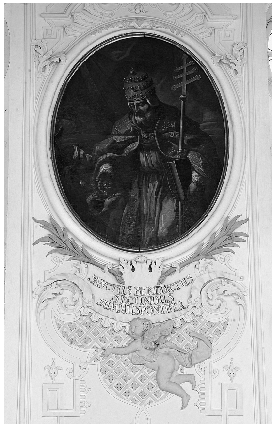
Abb. 5: St. Florian, Augustiner Chorherrenstift, Sommerrefektorium, 1731, Papst Benedikt II.

Die Programmatik des Refektoriums von St. Florian steht somit ganz im Zeichen der „Repräsentation des Ordenslebens der Augustiner-Chorherren“. 44 Es ist gleichsam ein „Ahnen-saal“ bzw. „Tugendspiegel“ des Ordens und besitzt somit die Funktion eines „klösterlichen Pendants zum Marmorsaal“. 45 In diesem Zusammenhang stellt sich die Frage, auf wen die Invention dieser in der Programmatik des Sommerrefektoriums manifesten Tenden-