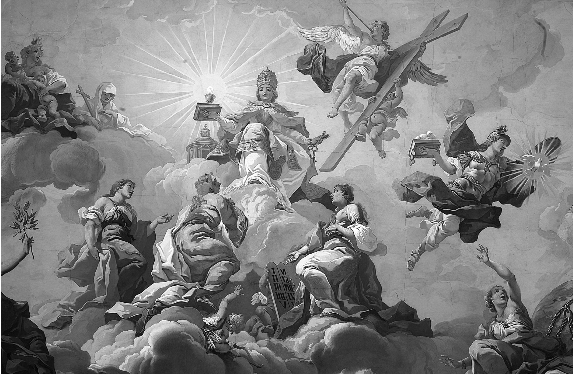
Abb. 3: St. Florian, Augustiner Chorherrenstift, Sommerrefektorium, 1731, Decke, zentrale Gruppe mit der Papstkirche und den drei Mönchstugenden.

Haar, Sternenglobus, einem Flammenbündel in der Rechten und einem Palmzweig in der Linken) die positiven Folgen der zentralen Vermählung der Kirche mit „ihren“ drei Gelübden verkörpern.