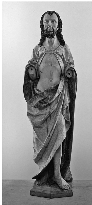
Obr. 7: Švábský sochař, Kristus Vítězný , konec 15. století, Moravská galerie v Brně, inv. č. Z 2707.

Přestože na konci třicátých let sběratelská činnost starohraběte Christiana ze Salm-Reiferscheidtu dle dochovaných dokladů kulminovala, nadcházející historické události měly