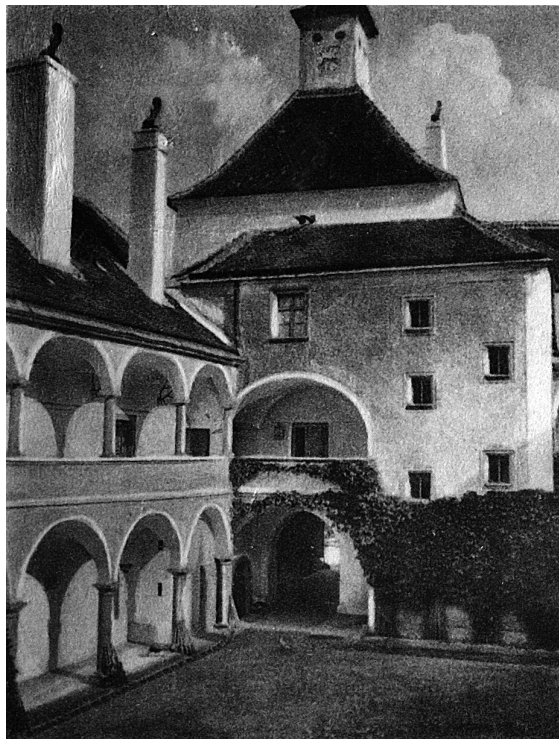
Obr. 1: Nádvoří zámku Budkov na dobové pohlednici, kolem 1930.

1878–1879. Itálie byla již od raného novověku oblíbeným cílem poznávacích cest představitelů šlechty a rovněž v 19. století si Apeninský poloostrov udržel pozici hlavního cíle dlouhodobých a opakovaných pobytů členů předních aristokratických rodin, přestože postupně získávaly na oblibě i vzdálenější destinace, např. země Blízkého východu. Böcklinův florentský ateliér patřil v té době k živým pamětihodnostem města a byl hojně navštěvován uměnilovnými cestovateli. Jeho známost s rodinou ze Salm-Reifferscheidtu však zřejmě nebyla jen epizodní záležitostí. Můžeme spíše předpokládat dlouhodobější vzájemné přátelské styky, o nichž svědčí mimo jiné skutečnost, že se Böcklin právě jejich prostřednictvím seznámil s berlínským uměleckým obchodníkem Fritzem Gurlittem. Tento syn malíře a rodinného přítele Salm-Reifferscheidtů Louise Gurlitta se