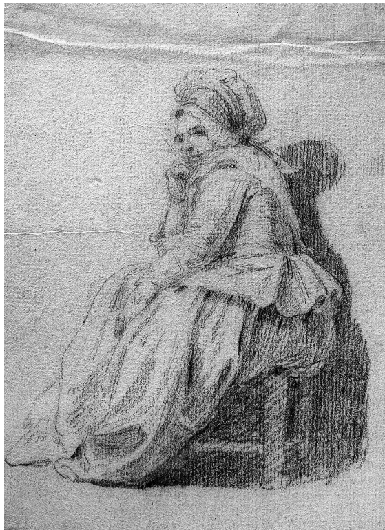
Obr. 6: Charles Parrocel, Sedící žena – studie, první polovina 18. století, kresba rudkou, papír, 208 x 150 mm, Moravská galerie v Brně, inv. č. SDK 421.