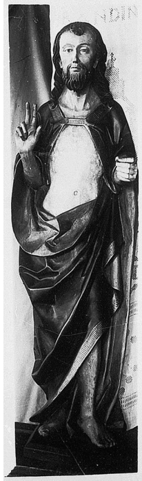
Obr. 8: Švábský sochař, Kristus Vítězný, konec 15. století, historický snímek z doby kolem 1906–1908 zachycuje stav před několikerým restaurováním v průběhu 20. století.

1950 dokončil studia dějin umění na univerzitě ve Freiburgu. Absolvoval u prof. Kurta Baucha disertační práci o Mistru z Meßkirchu a i nadále se odborně věnoval především německému středověkému umění, o čemž svědčí jeho poměrně rozsáhlá bibliografie. 54 Fürstenberské državy v oblasti Baar nabízely Christianu ze Salm-Reifferscheidtu navíc také široké uplatnění v oboru praktické památkové péče, jíž se věnoval již v meziválečném období. Po více jak desetiletém působení v Donaueschingen přesídlil v roce 1958 do Mnichova, kde pracoval jako hlavní konzervátor a odborník na staroněmeckou malbu v Bayerische Staatsgemäldesammlungen (Alte Pinakothek) a v letech 1966–1968, krátce před svým předčasným penzionováním, jako ředitel správy Staatliche Bayeri-