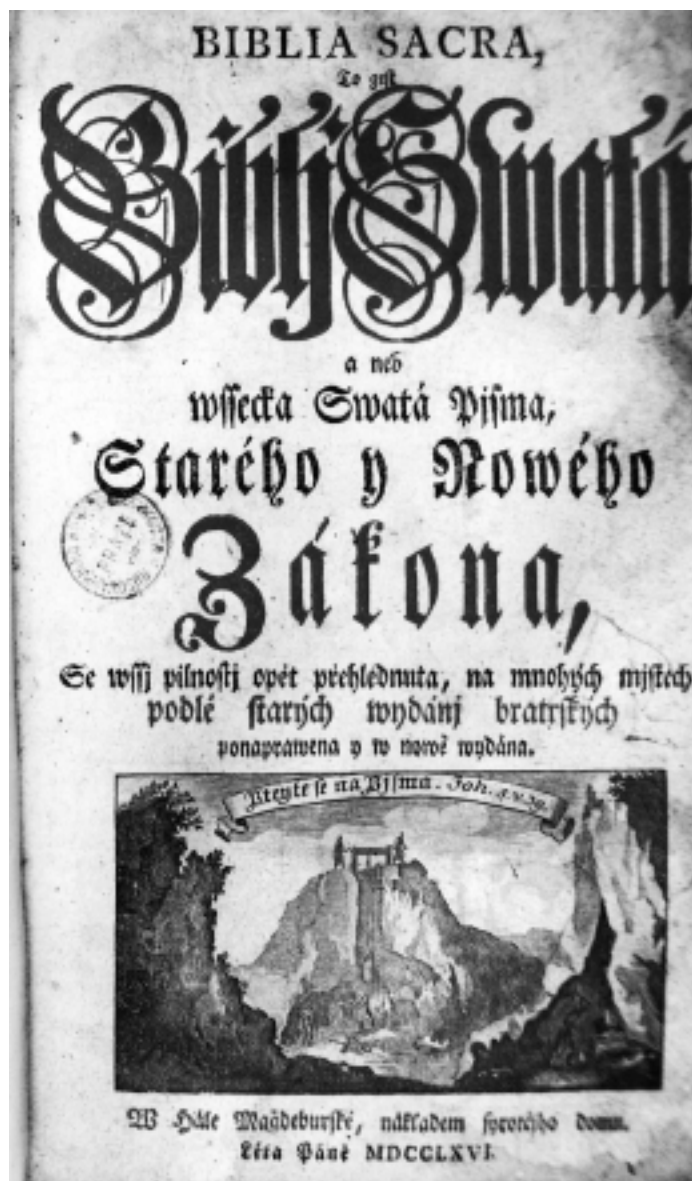
Obr. 3 Titulní list třetího vydání Hallské Bible

Třetí vydání Hallské Bible (1766) se stalo vzorem pro bible českých protestantů na následujících sto let. Platilo to i o výtvarném provedení jejich titulních stran.