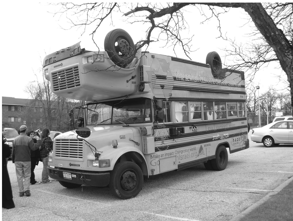
Obr. č. 17: Příklad environmentálního aktivismu i mezi „tradičními“ náboženskými skupinami. Podpora mezinárodního projektu The Jewish Climate Change Campaign hnutím Hazon.

Konkrétním projevem jsou pak takové fenomény jako již zmiňovaný televangelismus nebo další způsoby „upoutávání pozornosti“ pomocí šoku, symbolické zkratky či skandálu. Dobrým příkladem bylo mediálně skvěle zvládnuté a připravené vystoupení pastora Terryho Jonese, duchovního malé fundamentalistické skupiny působící na Floridě, který na 11. září 2010 vyhlásil „Mezinárodní den pálení Koránu“. Efekt této provokativní a kontroverzní akce byl mimořádný. Během několika dnů se stal Terry Jones mediální hvězdou a jeho kongregace, mající všeho všudy čtyřicet členů, jednou z nejznámějších ve Spojených státech. 71