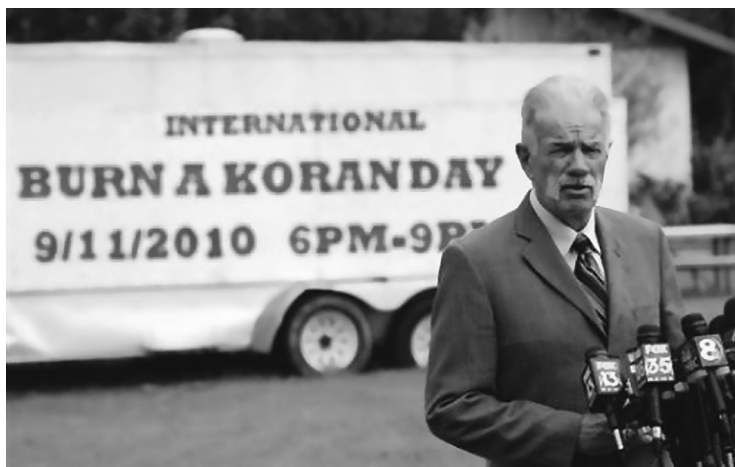
Obr. č. 18: Pastor Terry Jones s reklamou na kampaň vyzývající k pálení Koránu, Florida. Zdroj: Terry Jones, Quran Burnig & the Ground Zero Mosque . In: Strange Culture [online] 9. 9. 2010. [vid. 2013-11-10]. Dostupné z: http://www.strangecultureblog.com/2010/09/terry-jones-quran-burnig-ground-zero.html

Pragmatismus amerického náboženství se ale neprojevuje jen tímto poněkud kontroverzním způsobem. Za jeho součást či výraz je třeba považovat i takové skutečnosti jako pečlivá volba klíčových témat činnosti (praktické i ideové) konkrétních skupin. V tomto ohledu je tak například zmíněná The Jewis Climate Change Campaign stejně tak projevem náboženského aktivismu , jako výrazem pragmatismu „amerického náboženství“ . Podobných příkladů z dalších oblastí, jako jsou třeba ochrana lidských práv, sociální rovnost či naopak zdůrazňování „tradičních hodnot“ typu individualismu, bychom mohli jmenovat celou řadu.