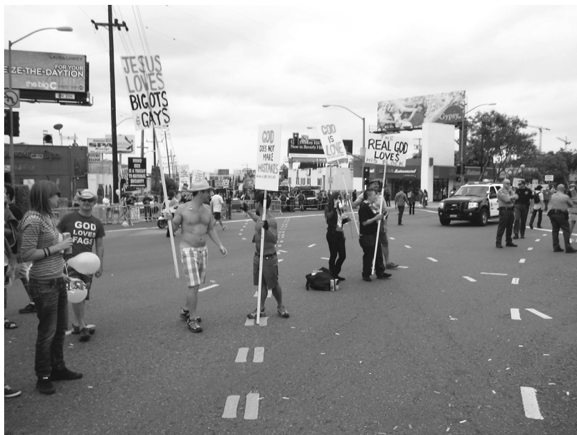
Obr. č. 16: Pochod křesťanských gay aktivistů. Grand Rapids, MI.

Výše uvedené příklady náboženského aktivismu nás přivádí k další „charakteristice“ náboženství ve Spojených státech, k jeho pragmatismu . Jako v mnoha dalších oblastech je i v případě náboženství typická tendence spojovat náboženské aktivity s konkrétními cíli a preferováním konkrétních přínosů či dopadů . V jistém smyslu slova můžeme v této souvislosti mluvit o instrumentalizaci náboženství , tedy o takovém pojetí náboženství, které ho chápe jako efektivní nástroj k prosazování konkrétních, často partiálních zájmů. Jedním z významných projevů pragmatismu americké religiozity je její schopnost pružně reagovat na situaci a tendence k maximalizaci efektivity . Spolu s populismem a aktivismem vede tento rys ke vzniku mnoha zajímavých, ale zároveň kontroverzních skutečností, jakými jsou například komercionalizace náboženství, vědomé a cílené používání marketingu při misijní činnosti, ale i při pastoraci, nebo snaha po maximálním využití potenciálu moderních masových médií.