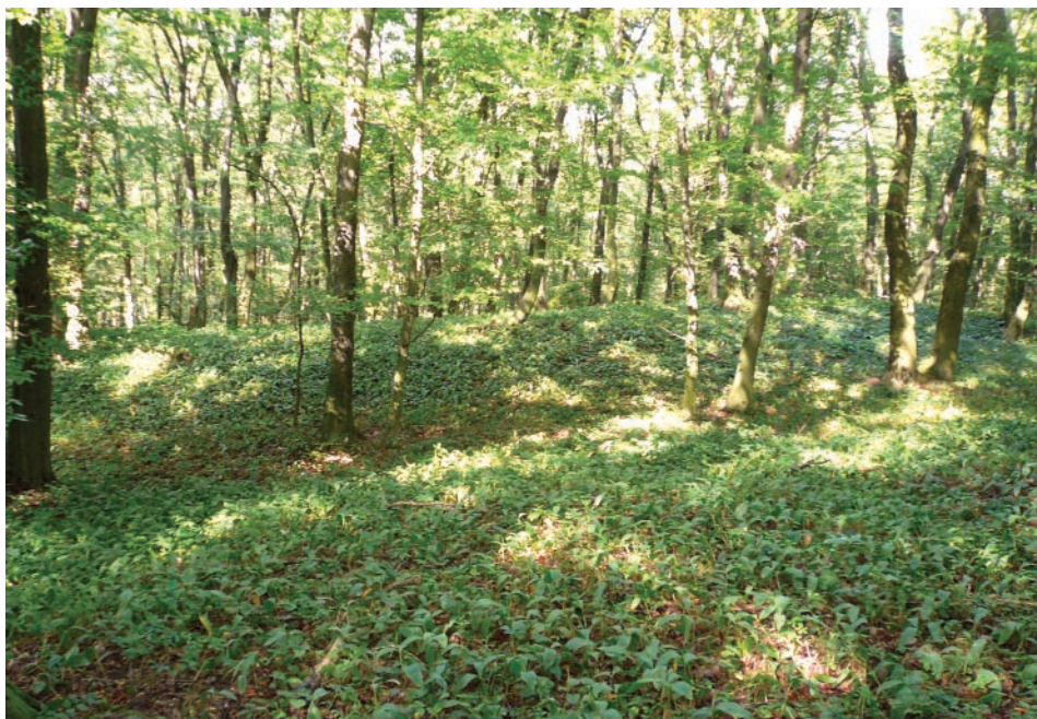
Obr. 4. Borkovany, okr. Břeclav. Čelo východní opevněné lokality při katastrální hranici Velkých Hostěrádek, pohled od jihozápadu.

plizlý, a tak je jasně viditelné jen projmutí příkopu na jižní straně. Ten je 12 m široký a pouze 0,7 m hluboký. Využitelná, téměř kruhová plocha hradiska má osy 46 a 41 m. Také jeho čelo proti stoupajícímu svahu chrání po obvodě oblouk valu, který je v koruně 3 m široký a oproti niveletě obytného areálu 2,3 m vysoký (obr. 4). Okružní příkop lze jen tušit v místě cesty na západě a v nepatrném zvlnění na protější straně.