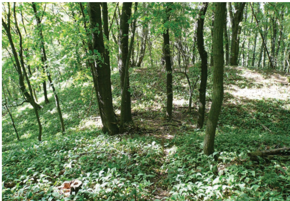
Obr. 3. Borkovany, okr. Břeclav. Pohled na štítový val lokality Hradisko přes šíjový příkop od jihu.

Hostěrádek ke křižovatce se silnicí Hodonín – Brno se cesta odpojuje u místního fotbalového hřiště, můstkem překračuje vodoteč Hunivky a stoupá k jihu přímo do svahu k první lokalitě. Od hlavní křižovatky ve Velkých Hostěrádkách je vzdálena přesně 1150 m jihozápadním směrem a nachází se v nadmořské výšce přibližně 260 m.