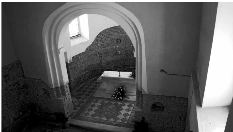
Obr. 7. Staré Hvězdlice, okr. Vyškov, kostel Všech svatých. Pohled z empory do loďe a apsidy; po stranách dohřívají oboustranně k východní stěně lodi s vítězným obloukem plochy tvořené odskoky ve zdivu. Foto autoři, 2014.