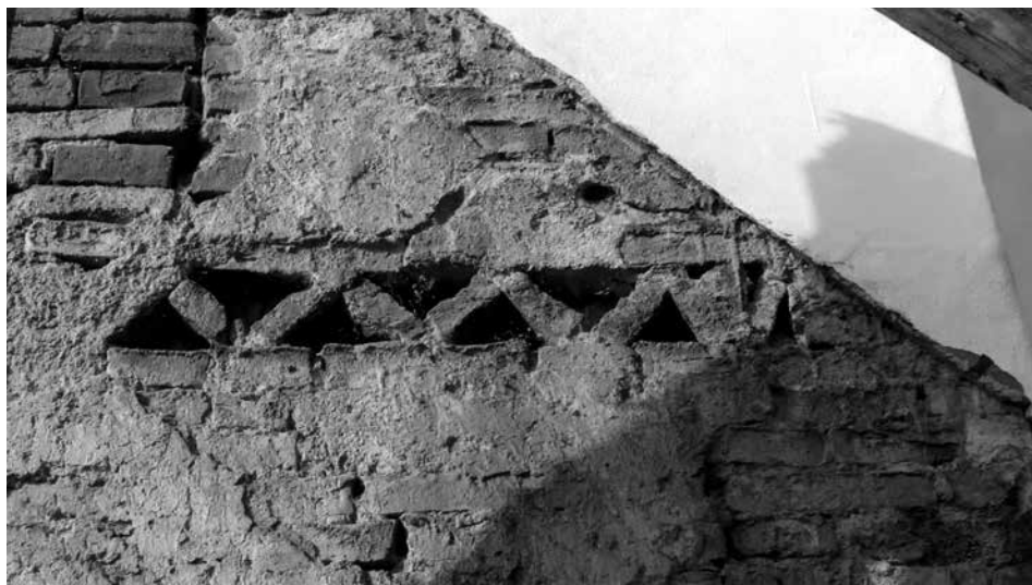
Obr. 9. Staré Hvězdlice, okr. Vyškov, kostel Všechných svatých. Detail fragmentu pilovitého vlysu východní stěny věže. Foto P. Dohnalová, 2012.