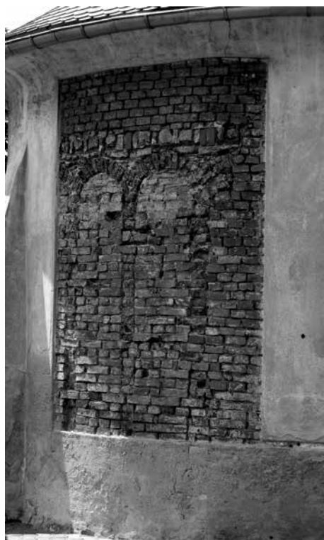
Obr. 4. Staré Hvězdlice, okr. Vyškov, kostel Všech svatých. Detail odhaleného torza románské dekorace. Foto autoři, 2014. Abb. 4. Staré Hvězdlice, Bez. Vyškov, Allerheiligenkirche. Detail des freigelegten Torsos der romanischen Verzierung. Foto von den Verfassern, 2014.

Nad nikami se nachází novější okenní otvor s dovnitř se rozšiřujícími špaletami, klopeným bankálem a segmentovým záklenkem. Nalevo od něj je ve zdivu patrný fragment levé špalety a náběhu parapetu zaniklého okna; špaleta je omítaná a nese zbytky líček.