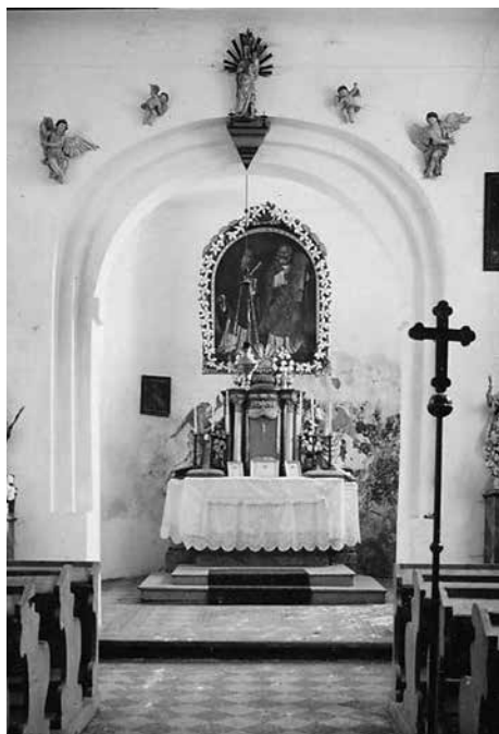
Obr. 11. Staré Hvězdlice, okr. Vyškov, kostel Všech svatých. Pohled z lodi do apsidy, 40. léta 20. století. Foto archiv NPÚ, ÚOP v Brně.

Abb. 11. Staré Hvězdlice, Bez. Vyškov, Allerheiligenkirche. Blick vom Kirchenschiff in die Apsis, vierziger Jahre 20. Jhdt. Foto Archiv des Nationalen Denkmalinstituts, regionale Fachstelle Brno.