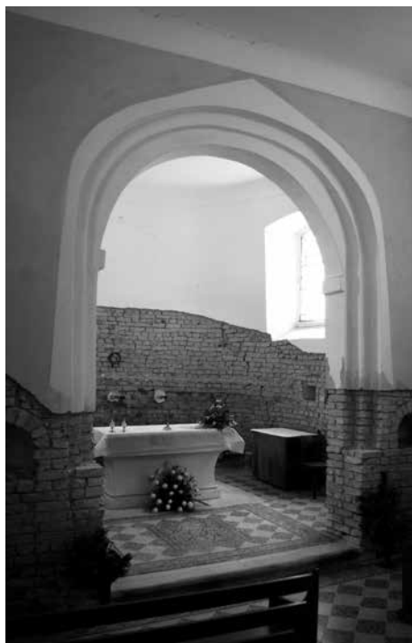
Obr. 6. Staré Hvězdlice, okr. Vyškov, kostel Všech svatých. Průhled vítězným obloukem z lodi; odhalené konstrukce trnože vítězného oblouku ukazují plně provázané zdivo, jde tedy o původní řešení. 2014.

Abb. 6. Staré Hvězdlice, Bez. Vyškov, Allerheiligenkirche. Durchblick durch den Triumphbogen vom Kirchenschiff aus; die freigelegte Sockelkonstruktion des Bogens zeigt das vollständig miteinander verknüpfte Mauerwerk, es handelt sich somit um die ursprüngliche Lösung. 2014.