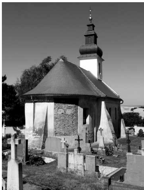
Obr. 1. Staré Hvězdlice, okr. Vyškov. Pohled na kostel Všech svatých od východu. Foto autoři, 2014.