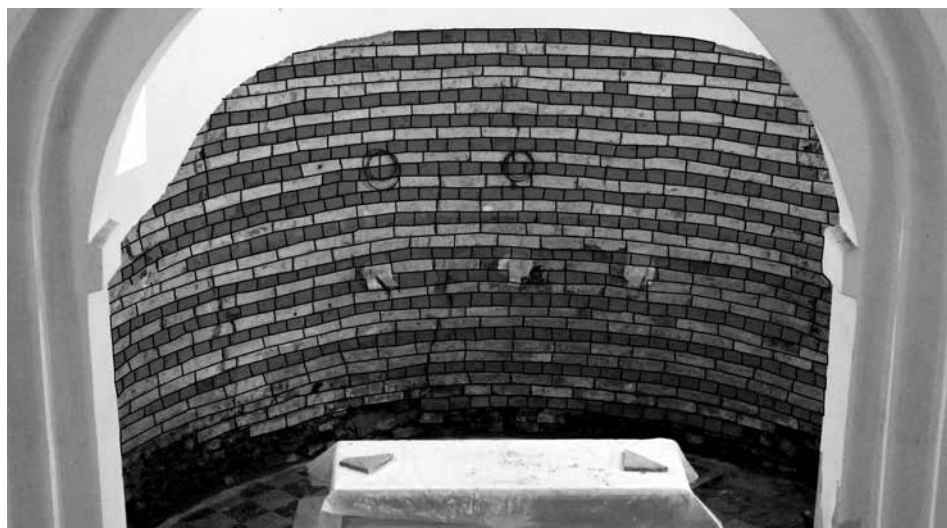
Obr. 5. Staré Hvězdlice, okr. Vyškov, kostel Všech svatých. Pohled do apsidy se zvýrazněnou skladbou zdiva. Foto autoři, grafická úprava J. Totušková, 2014. Abb. 5. Staré Hvězdlice, Bez. Vyškov, Allerheiligenkirche. Blick auf die Apsis mit hervorgehobenen Stellen des Mauerwerksverbands. Foto von den Verfassern, grafische Gestaltung J. Totušková, 2014.

Skladba zdiva triumfálního oblouku je obdobná jako u presbytáře (nejčastěji zde nalezneme střídavé vrstvy běhounů a vazáků).