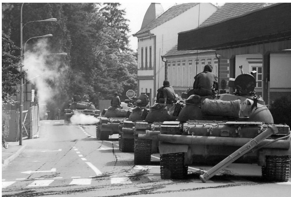
Tanky JLA v ulicích Ormože - 1991

Situace ve Slovinsku nebyla v prvních dnech jednoduchá. Předsednictvo svazové skupštiny prohlásilo hned 25. června vyhlášení nezávislosti Chorvatska i Slovinska za protiústavní a tudíž právně neplatné. Zároveň vyzvala svazovou vládu, aby zabezpečila výkon pasové služby a výběr