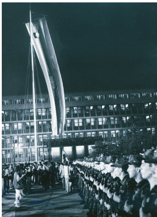
Vyhlášení slovinské nezávislosti 25. 6. 1991

Slovinským a chorvatským představitelům se zřejmě podařilo během roku 1991 získat určitou podporu ve Spolkové republice Německo a v Rakousku. I když představitelé ES Jacques Delors a Jacques Santer během návštěvy Bělehradu 29. a 30. května 1991 opět žádali od Ante Markoviće udržení jednoty Jugoslávie a ačkoliv představitelé ES opakovaně zdůrazňovali, že neuznají nezávislost jednostranně se