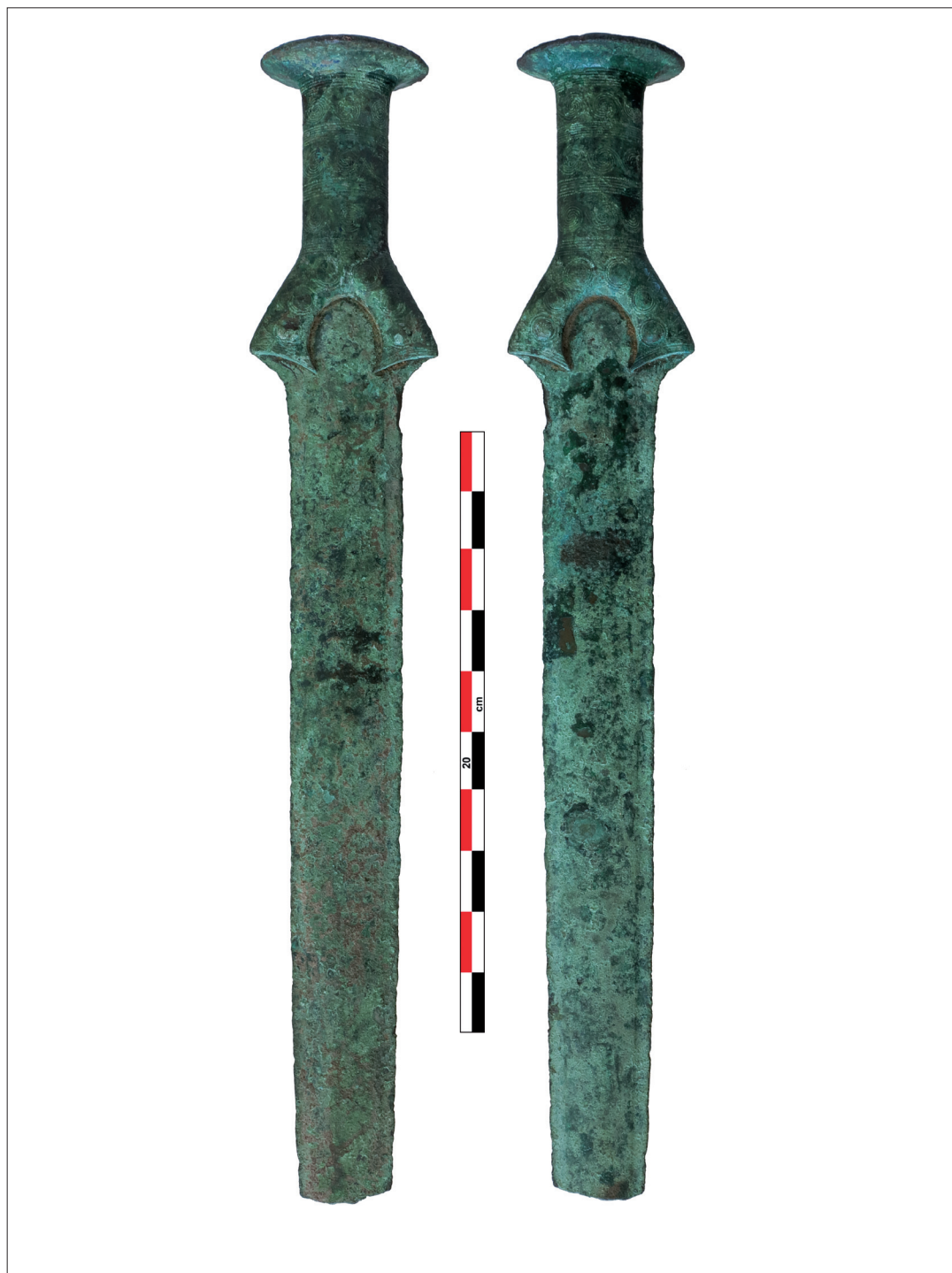
Abb. 1. Vollgriffschwert von Witzelsdorf, Niederösterreich.