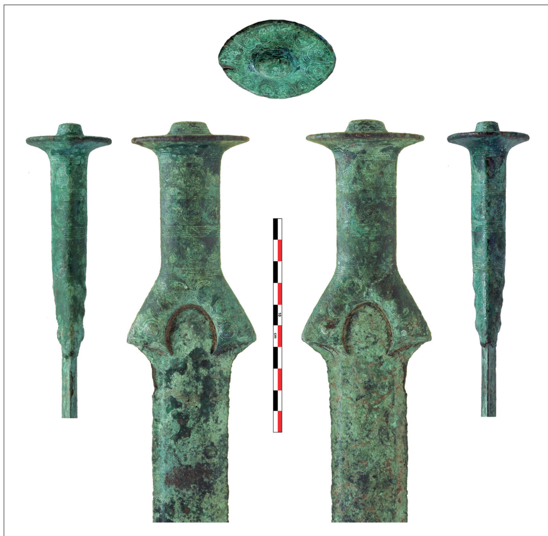
Abb. 3. Vollgriffsschwert von Witzelsdorf, Niederösterreich. Griff- und Klingenanatz.