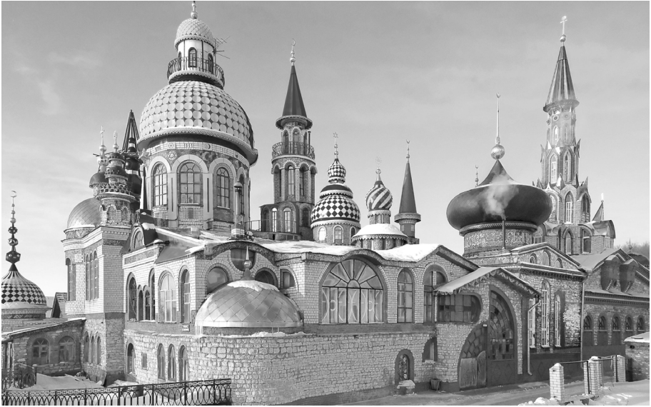
Obr. 4. Chrám všech náboženství na okraji Kazaně